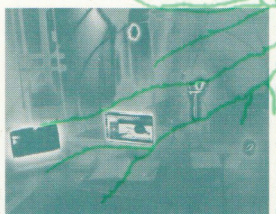
Ecological Space Engineering

E.S.E. is een fictief bedrijf dat zich richt op het ontwikkelen van materiaal voor gesloten ecologische systemen. De installatie verbeeldt een geocentrisch wereldbeeld waar een kunstmatige zon en maan omheen cirkelen. In het midden bevindt zich organisch leven zoals planten, schimmels en bacteriën in een bol waarin het klimaat mechanisch in stand gehouden wordt. Gedurende de tentoonstelling vervalt de natuur langzamerhand en maakt plaats voor nieuw leven in de strijd om te overleven. In het Glazen Huis wordt het tijdelijke kantoor opgebouwd waarin er met enige regelmaat nieuwe objecten bij geplaatst worden en met behulp van diverse media inzicht in hypothetische ontwikkelingen gegeven worden.