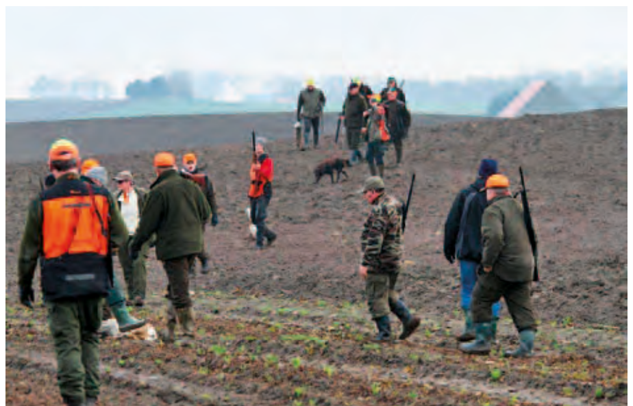
Fotografer på Sponsorjakten var Ola Hugoson och Pierre Hammanstrand.