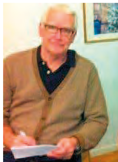
Rune Smith, Kvällsposten

JG är framtidens stjärna och han höll just i ett kritiskt läge, matchen mot Drott, hela Ystad kvar på gott humör. Över strecket och nära toppskiktet. Nog så bra. Förhoppningsvis har det fortsatt i rätt riktning (vet ju inte i skrivande stund). Ändå måste jag ställa ovanstående kritiska frågor, eftersom YIF:s svackor under säsongen inte borde dyka upp så ofta med tanke på ett högklassigt spelarmaterial.