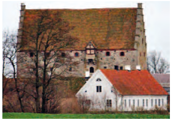
Slättjakt på Glimmingehus.

Bilder från ett axplock av YIF Handbolls sponsoraktiviteter under innevarande säsong.