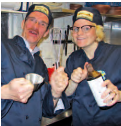
Matlagningskurs. Glada miner när Yif:s sponsorer lär sig laga mat.