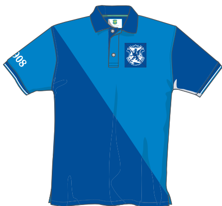
Y.I.F – Polo. Herr S-XXXL, Dam XS-XXL. Pris: 495kr