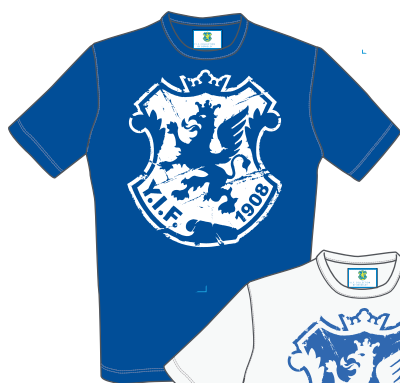
Y.I.F – T-shirt. Unisex. Strl XS-XXXL. Pris: 295kr