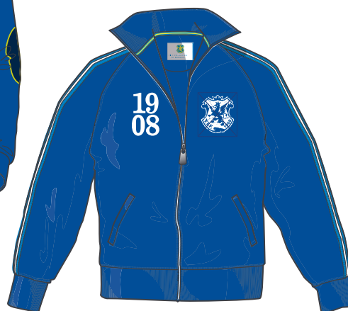
Y.I.F – Retro Zipper Unisex. XS-XXXL. Pris: 795kr