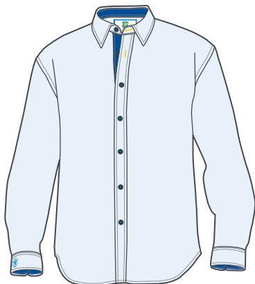
Y.I.F – Twofold Skjorta. Dam, Herr + Slimfit Pris: 695kr