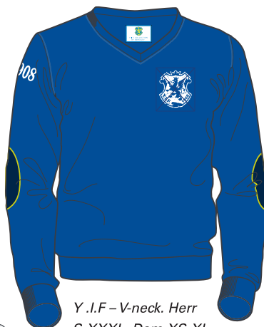
Y.I.F – V-neck. Herr S-XXXL, Dam XS-XL. Pris: 695kr