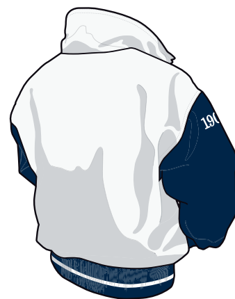
Y.I.F – Jacka. Unisex. Strl XXS-XXXL. Pris: 1995kr