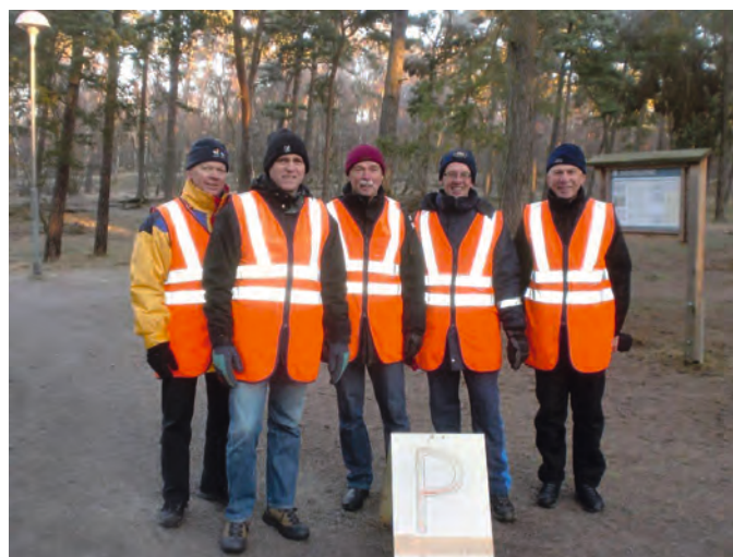
Dessa män är ansvariga och ser till att det fungerar.