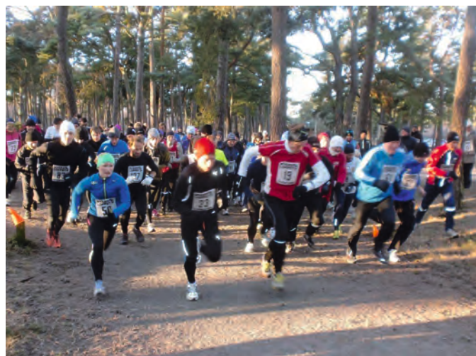
Här går starten. Springa, jogga eller gå? Välj själv!