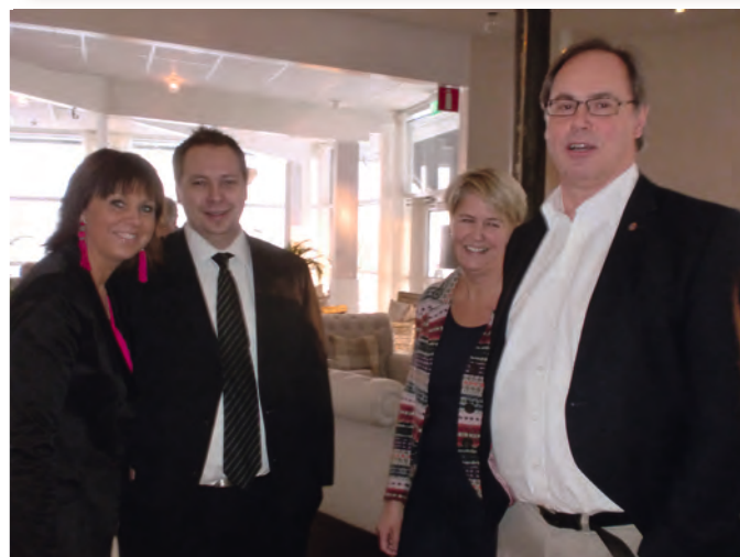
Glada YIFare på plats.