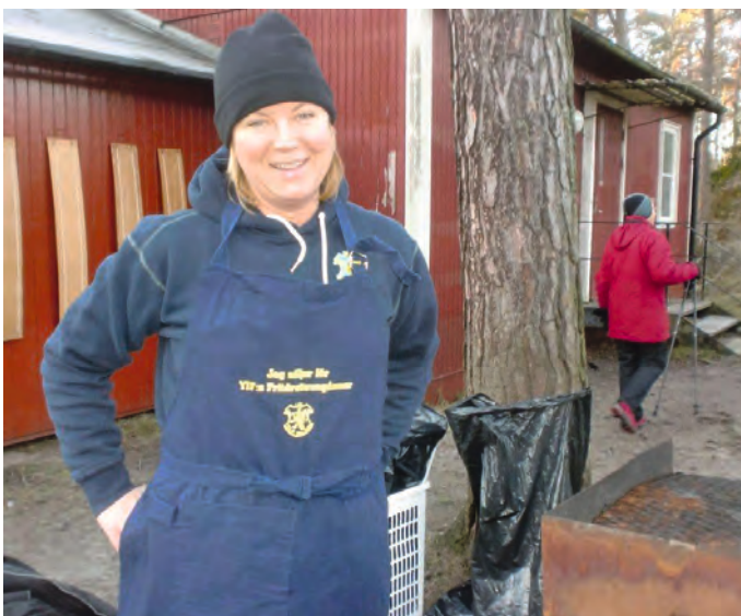
Efter loppet kan man köpa grillad korv och dricka.