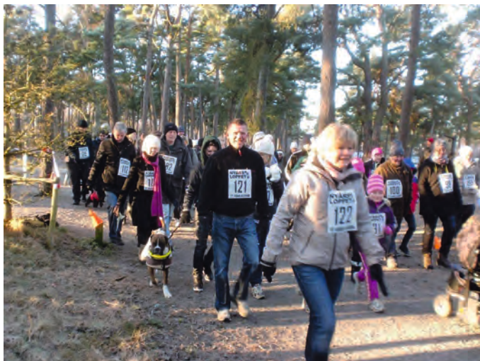
Nästan 200 kom till starten. Inte illa, eller hur?