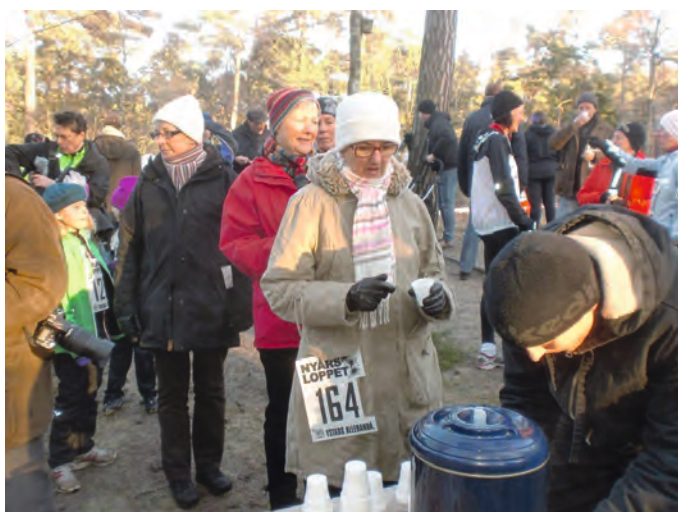
Efter målgång bjöds det på varm saft samt utlottning av priser på startnumret för endast 20 kr!