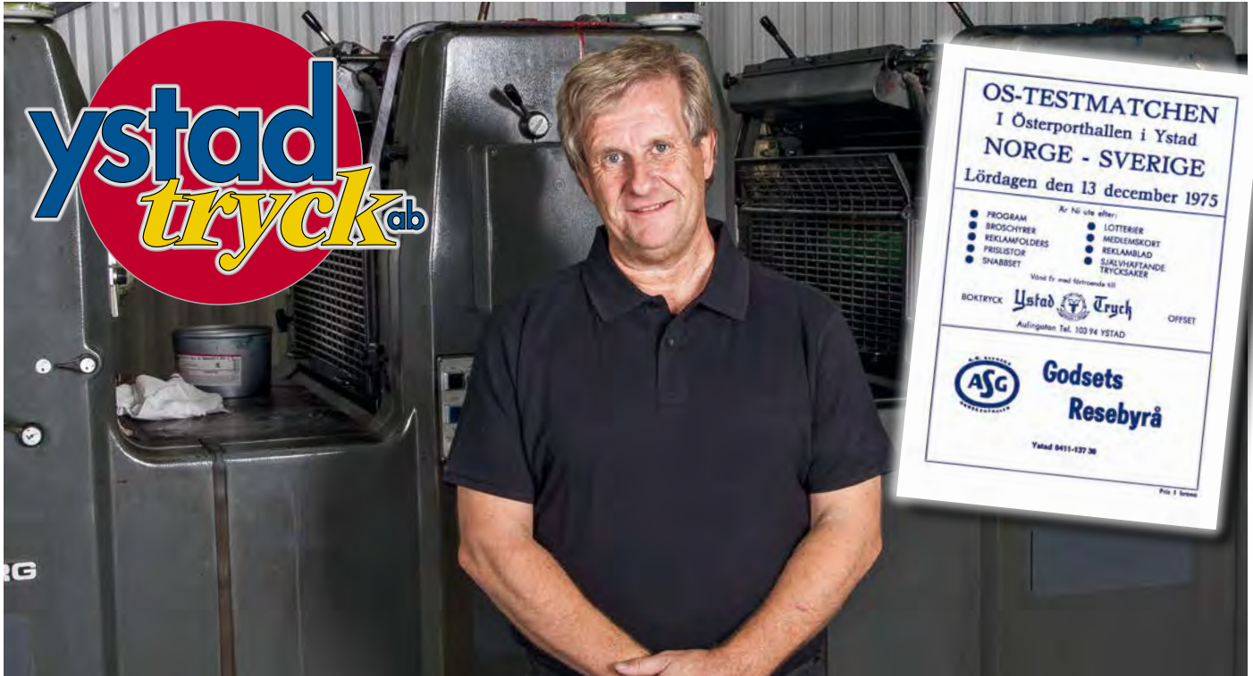
Program från en tidig match i ÖP-hallen.