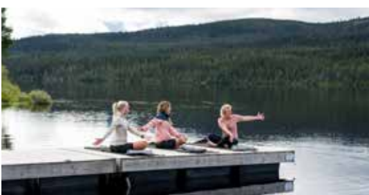
BERG-YOGA OP PRACHTIGE LOCATIES