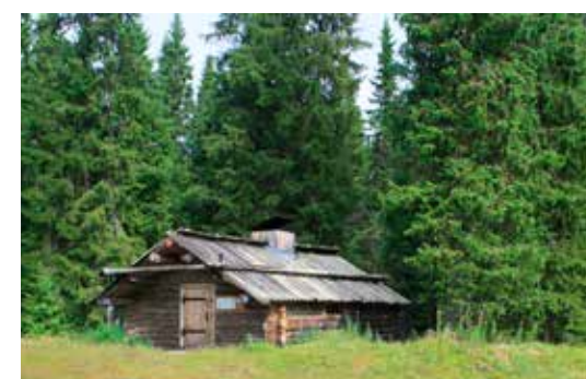
BEZOEK EEN PELGRIM 'ZIELENSTUGA'