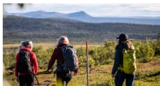
VERKEN DE BERGEN MET LOKALE GIDS