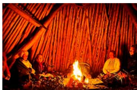
MAAK KENNIS MET DE SAMI-CULTUUR