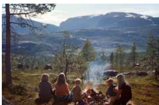
CURSUS VUUR MAKEN