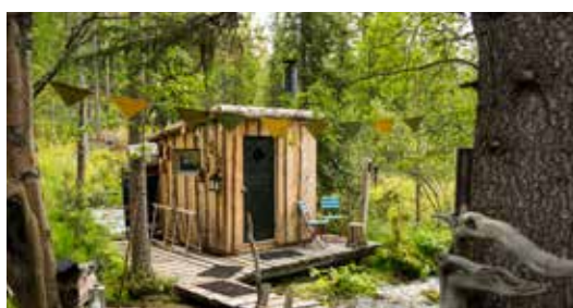
SAUNA EN BEEKBAD