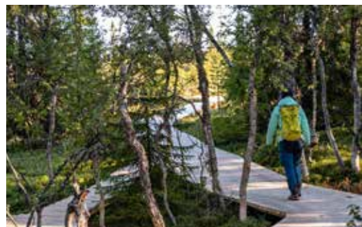
WANDEL/FIETS HET PANORAMAPAD