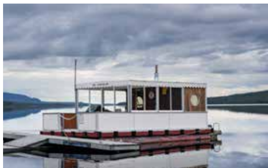
SAUNABOOT MET BBQ AAN BOORD