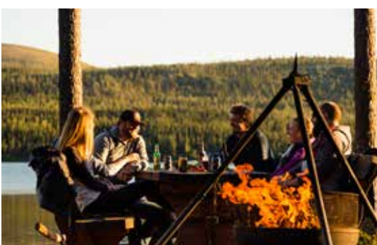
LANGE DAGEN MET MIDDERNACHTZON