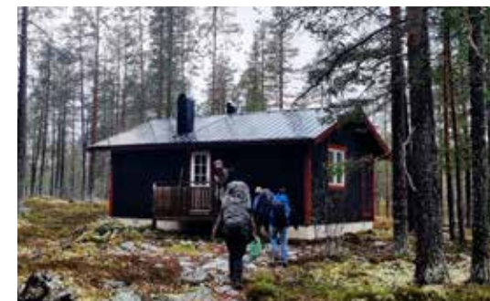
OVERNACHTING IN EEN WILDKIJKHUT