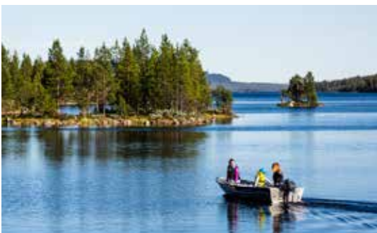
VISSEN MET GIDS OF KANOTOCHT