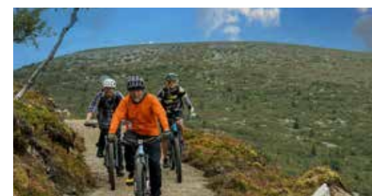
MOUNTAINBIKE TOUR MET GIDS