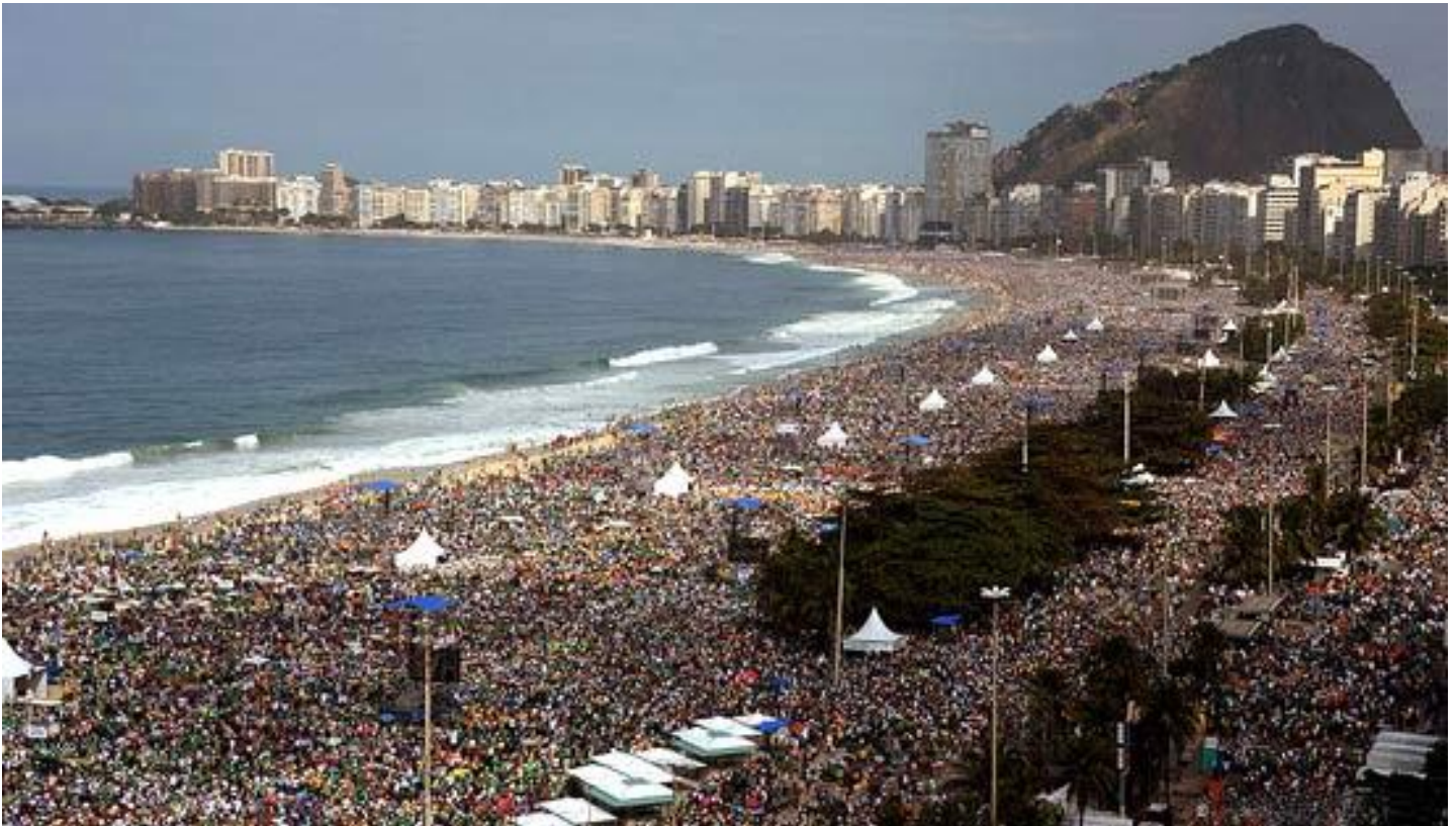
Massa-bijeenkomst op het wereldvermaarde strand van Copacabana.

Op honderden plaatsen in de gaststad waren er optredens, sportmanifestaties, rondleidingen in filmvoorstellingen, getuigenissen, workshops, musea en gebedsmomenten. Het eerste sterke moment was, de ontmoeting met de paus op het strand van Copacabana, met jongeren uit de vijf continenten. De vreugde de paus te zien op redelijke afstand, heeft onze levens getekend en we zongen van alle kanten " Dit is de jeugd van de Paus ".