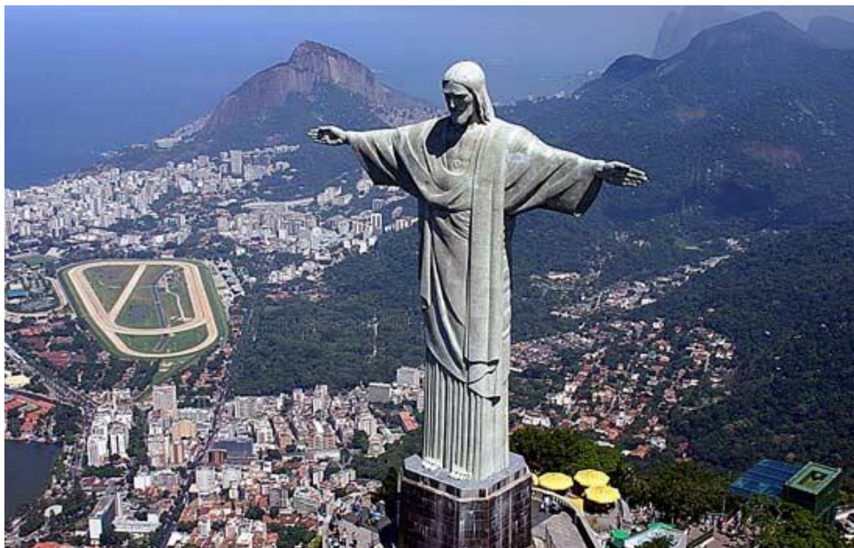
Het wereldberoemde Christusbeeld boven op de Corcovado-berg bij Rio

In 1984 nodigde paus Johannes Paulus II de jongeren van de hele wereld uit naar Rome te komen om het internationale jubileum van de jeugd te vieren. Vanaf dat moment keren de Wereldjongerendagen (voortaan afgekort als WJD) telkens terug, elke keer in een ander gastland. Na Rome, Buenos Aires, Santiago de Compostela, Czestochowa, Denver, Manilla, Parijs, weer Rome, Toronto, Keulen, Sydney en Madrid was nu het Braziliaanse Rio aan de beurt. De organisatoren hoopten dat er in de zomer meer dan 2 miljoen jongeren aan de WJD in Rio zouden deelnemen. De meest succesvolle editie van de WJD was de tiende editie van 1995 in de Filipijnse stad Manilla. Toen namen 3,5 miljoen tot 4 miljoen jongeren aan de WJD deel.