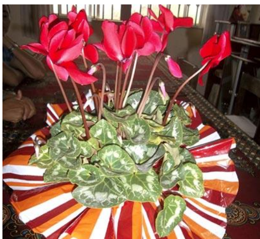
Zo'n trouwe inzet verdient een bloemetje!