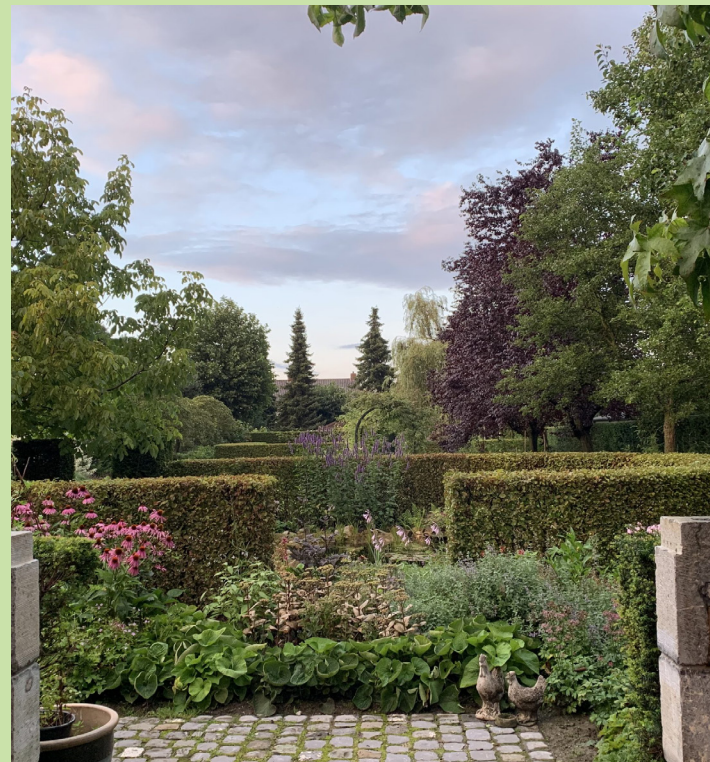
Tuin in de Mehre 2

Adres: Lanterdijk 43, 6116 AH Roosteren +31 (0) 6 30 56 33 46 Facebook: Hoeve Schettereind info@hoeveschettereind.nl www.hoeveschettereind.nl