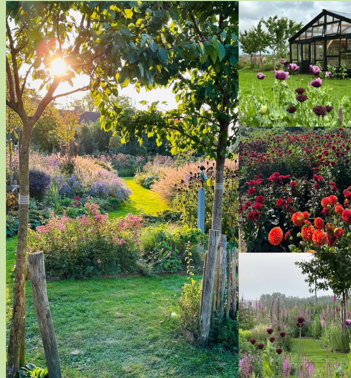
De Goede Gaard 3

Adres: in de Mehre 73 6114 NE Susteren +31 (0) 6 10 92 26 78 info@tuinindemehre.nl www.tuinindemehre.nl