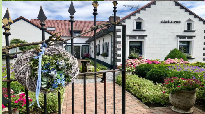
Hoeve Schettereind 1

In het noordelijkste puntje van Zuid-Limburg – het buitengebied van Roosteren – en het smalste stukje Nederland ligt rond een authentieke boerenhoeve deze landelijke tuin van bijna 7000 m2. In de lente bloeien hier tienduizenden tulpen en andere bolgewassen, in de zomer zijn de borders rijk gevuld met vaste planten, eenjarigen en dahliã's.