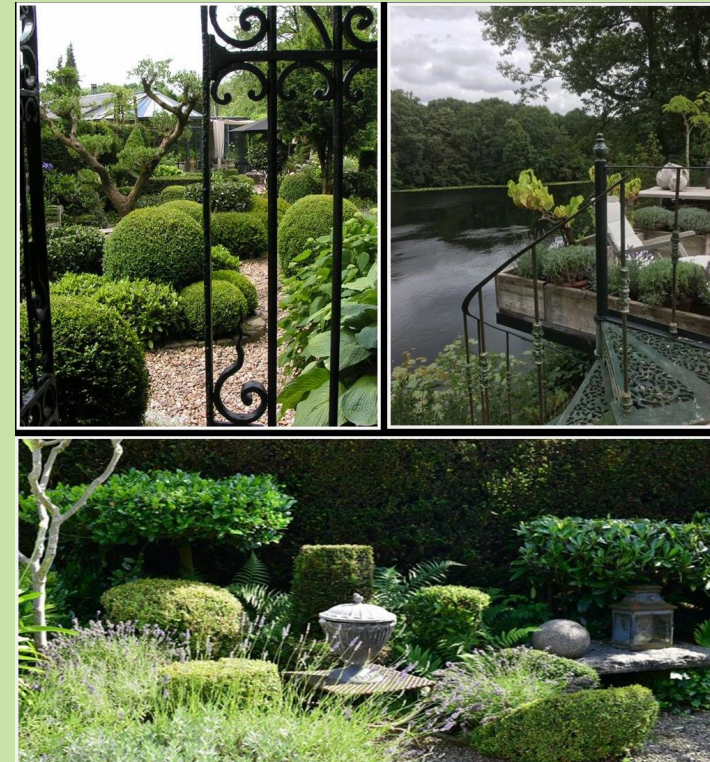
Le Jardin de Pauline 4

06-295 24 295 (Babke) 06-533 33 899 (Frans) info@degoedegaard.nl www.degoedegaard.nl