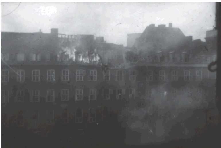
Brand i Teknologisk Institut overfor Ingeniørforeningens Hus, Vestre Farimagsgade.