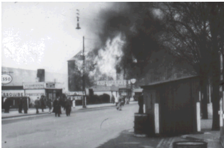
Shell-Huset brænder. Foto taget fra Vester Farimagsgade, Vesterport station til højre for fotograf.

Den egentlige årsag til katastrofen var, at flyene skulle flyve i lavest mulig højde over Nordsøen for at undgå at blive opdaget af den tyske radar. Den ret kraftige vind denne dag, gav høje bølger, og skumsprøjt herfra satte sig på frontruderne og fik dem til at salte til. Det nedsatte sigtbarheden, og det må antages at være den egentlige årsag til, at førerflyet i 1. bølge ramte lyskasteren med den ene vinge.