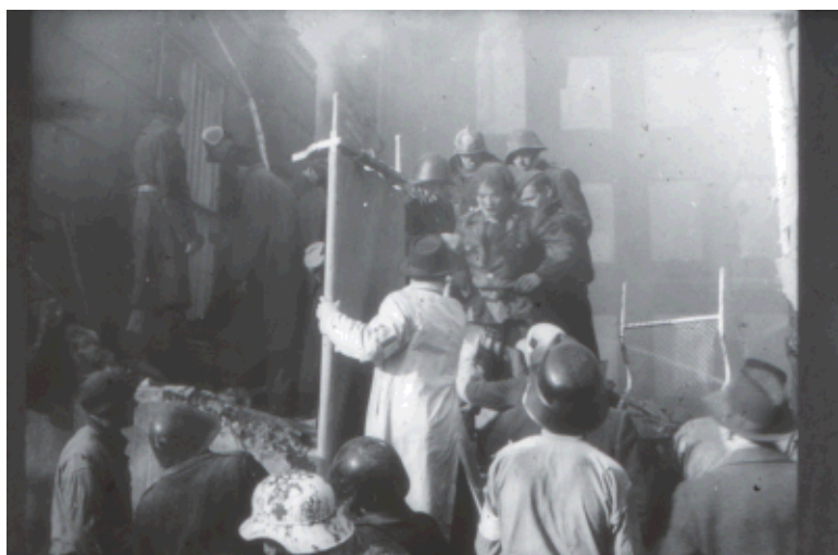
Personredning, måske en hjælpearbejder. Billedet er i Frederiksberg Brandvæsens arkiv mærket "HIPO-mand" og er formentlig en af de HIPO-folk, der hjalp ved redningsarbejdet.

Opgaverne havde været mangeartede under besættelsen, men denne katastrofe hvor det var børn, der var ofrene, fik redningsfolkene til at glemme sig selv, og yde alt, hvad de havde i sig. Nerver var der på, for ingen kan vænne sig til en sådan opgave. Nogle har nok ikke været helt tilfredse med deres indsats og følt, at de burde have ydet mere, men i virkeligheden havde de presset sig selv til det yderste.