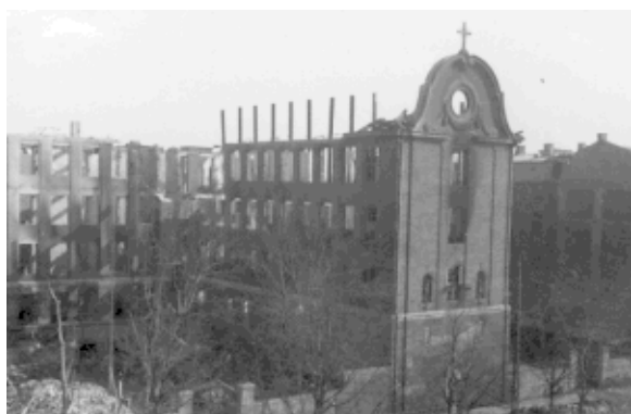
Ruinerne af Den Franske Skole.