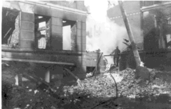
Fra redningsarbejdet ved Den Franske Skole.

Løsarbejderne fik befriet et antal børn og nonner fra et ubeskadiget beskyttelsesrum, hvor de havde været indespærret. Nu kom de og hjælp hos os. Brandfolk, Zonefolk, CBér og civile dannede kæde. Der blev brudt hul i muren, og murbrokker, tømmer og træstumper langes ud én for én eller i spande som kunne passere de snævre åbninger. Da røgen tiltog måtte der indsættes røgdykkere og der blæstes frisk luft ind til de indespærrede. Kommandoforholdene var løse og både rednings- og slukningsarbejdet uoverskueligt. Det var nødvendigt at indsætte pumper, da der samledes mere og mere vand, dels fra slukningsarbejdet, dels fra et ledningsbrud."