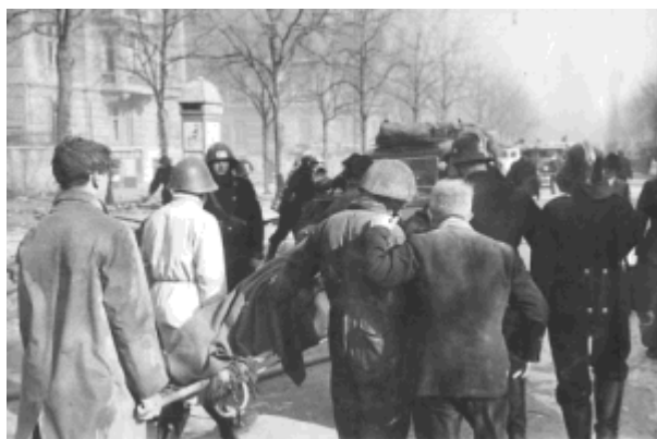
Frederiksberg Allé under redningsarbejdet ved Den Franske Skole.

Bombeangrebet var kommet ligeså overraskende for luftværnet som for tyskerne, så deres mandskab var ikke på plads.