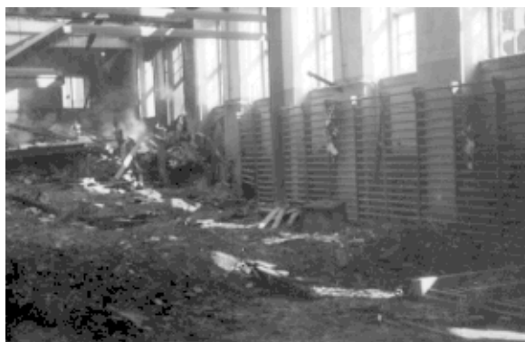
Gymnastiksalen næsten ubeskadiget.