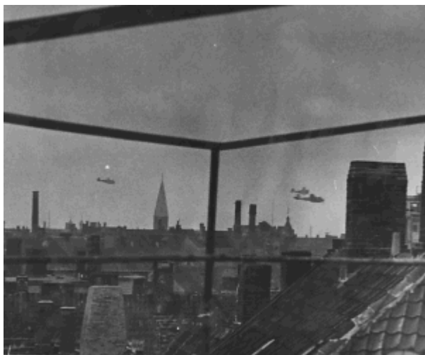
Engelske RAF-fly på vej ind over København 21. marts 1945.

Kl. 11:15, kom 20 Mosquito-bombefly ledsaget af 26 Mustang-jagerfly samt to fotofly i lav højde langs banegraven ved Vigerslev Allé. De var formeret i tre angrebsbølger. Førermaskinen i 1. bølge kom til at strejfe en lystkastermast ved jernbaneterrænet umiddelbart ved Enghavevej og Ingerslevsgade, hvorved den kom ud af kontrol.