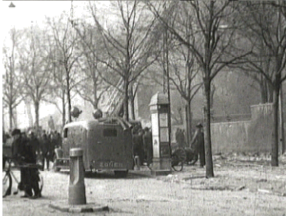
ZR's ambulance og katastrofevogn foran Den franske Skole på Frederiksberg Allé.