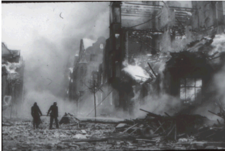
Maglekildevej set fra Dr. Priemes Vej.

Både Københavns- og Frederiksberg Brandvæsen - rådede over radiosender og -modtager i deres kommandovogne, men den 29. august 1944 forbød den tyske værnemagt brandvæsenerne at anvende dem, og den 1. februar afhentede det tyske sikkerhedspoliti radiomateriellet og opmagasinerede det i Ingeniørhuset, hvor det gik tabt ved bombeangrebet. Dette, i forbindelse med, at både det offentlige, og luftværnets eget telefonnet, var brudt sammen, gav problemer med at få de nødvendige meldinger frem. Der var faktisk kun ordonnanser tilbage, hvis de var der. Det gav i næsten hele forløbet af redningsindsatsen store ledelsesmæssige problemer.