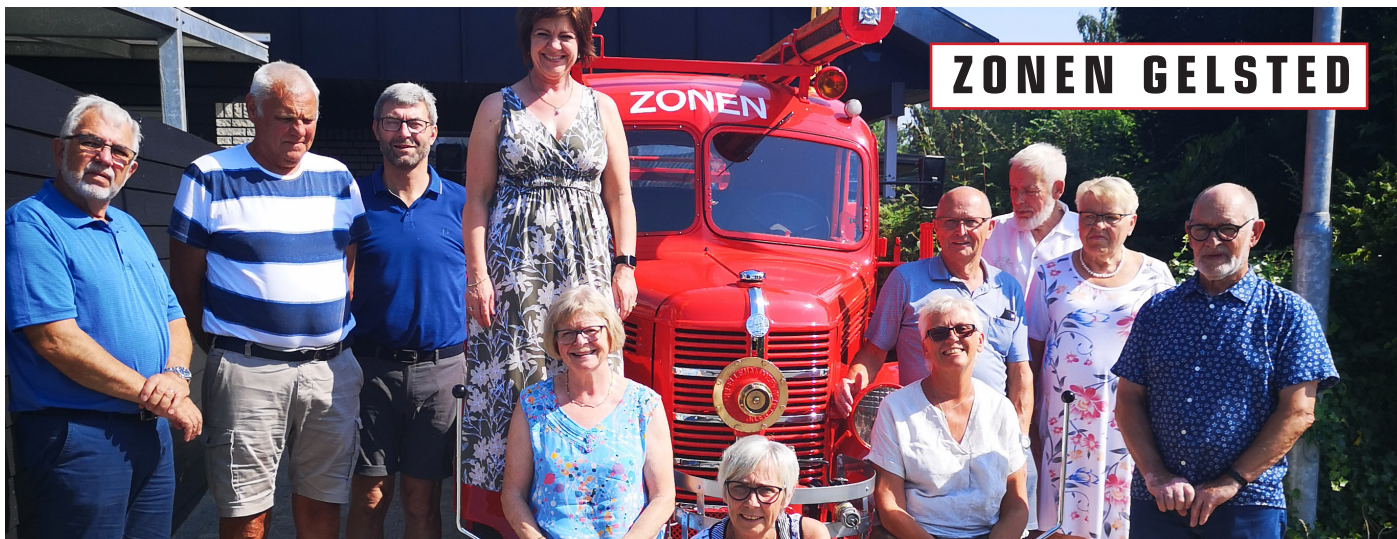
Corona-pausen tillod afholdelse af sommerfest med ægtefæller for medlemmerne af garageholdet