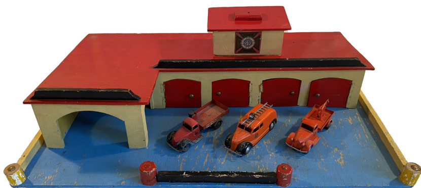
Zonen legetøjsstation i træ. Datering 1950'erne. Fundet af medlem på loppemarked. Tekno-bilerne er fra den bestående samling