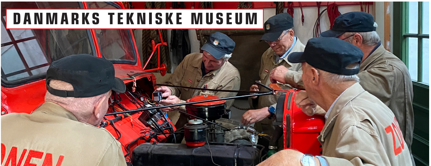
Der arbejdes på kranvognen ZR 378