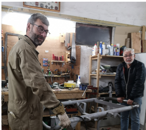
Øverst: Sprøjten æresgæst på biludstilling i Herning i efteråret 2021