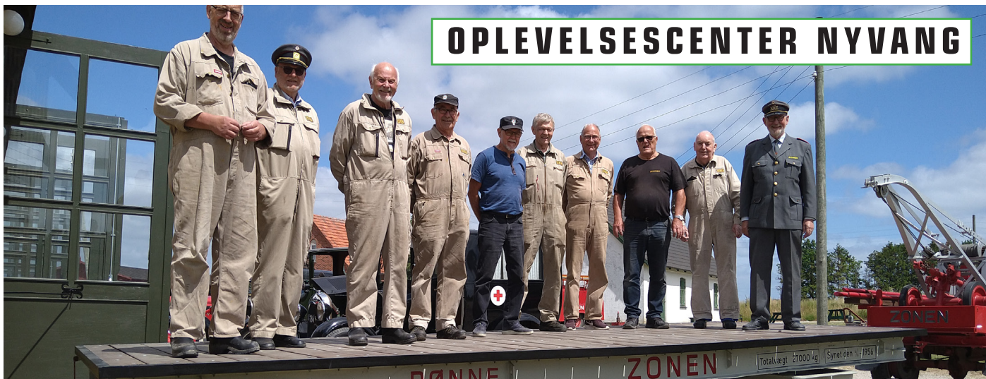
Den færdigrestaurerede blokvogn præsenteres i juni. Projektet er støttet af VELUX FONDEN