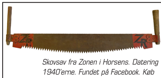
Skovsav fra Zonen i Horsens. Datering 1940'erne. Fundet på Facebook. Køb