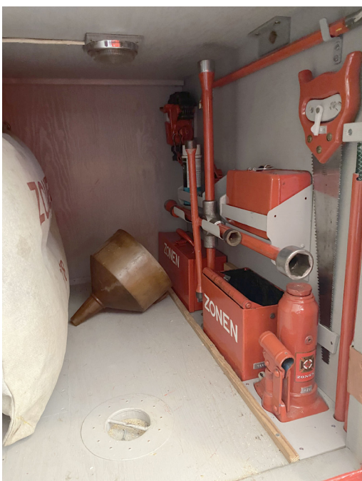
Øverst: I Høvelte til Landrover-træf med ZR 714 bugservogn og ZR 768 ambulance