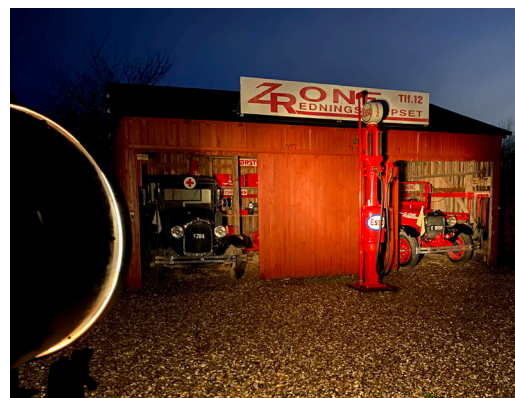
Øverst: Ford AA Udrykningsvogn 1928