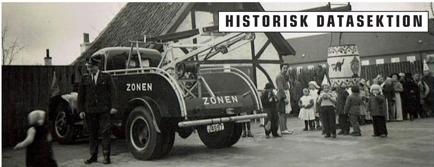
Tøndeslagning hos Zonen i Rønne ca. 1947. Billedserie fra privat giver modtaget i 2021