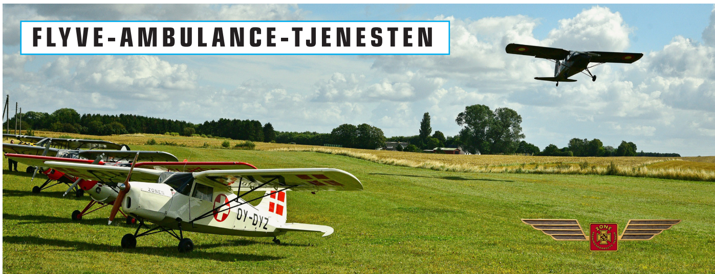
Flyparade og gæster ved Veteranflyvedagen i Oplevelsescenter Nyvang den 15. august 2021