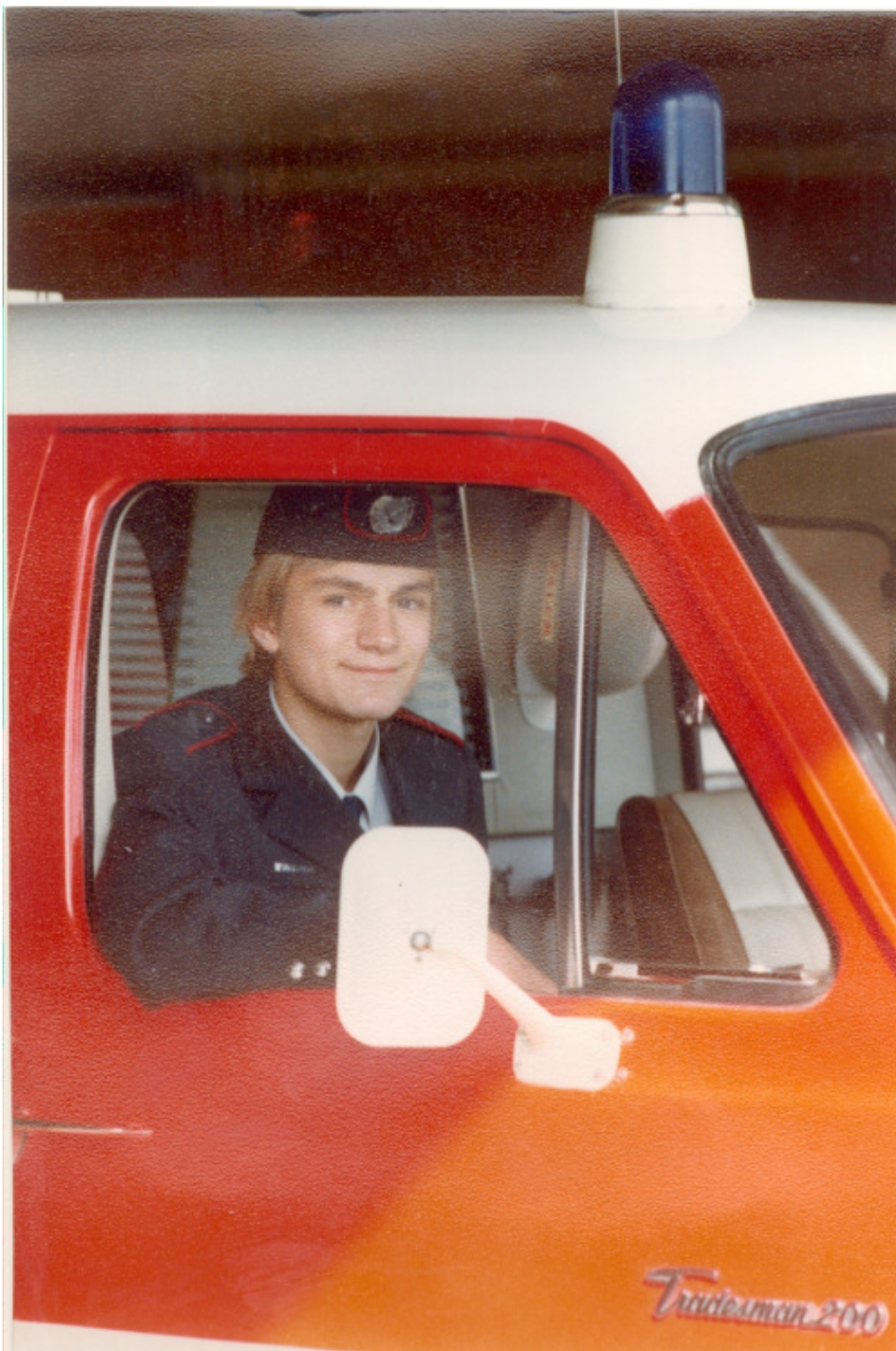
Falck Næstved ca. 1975-1981