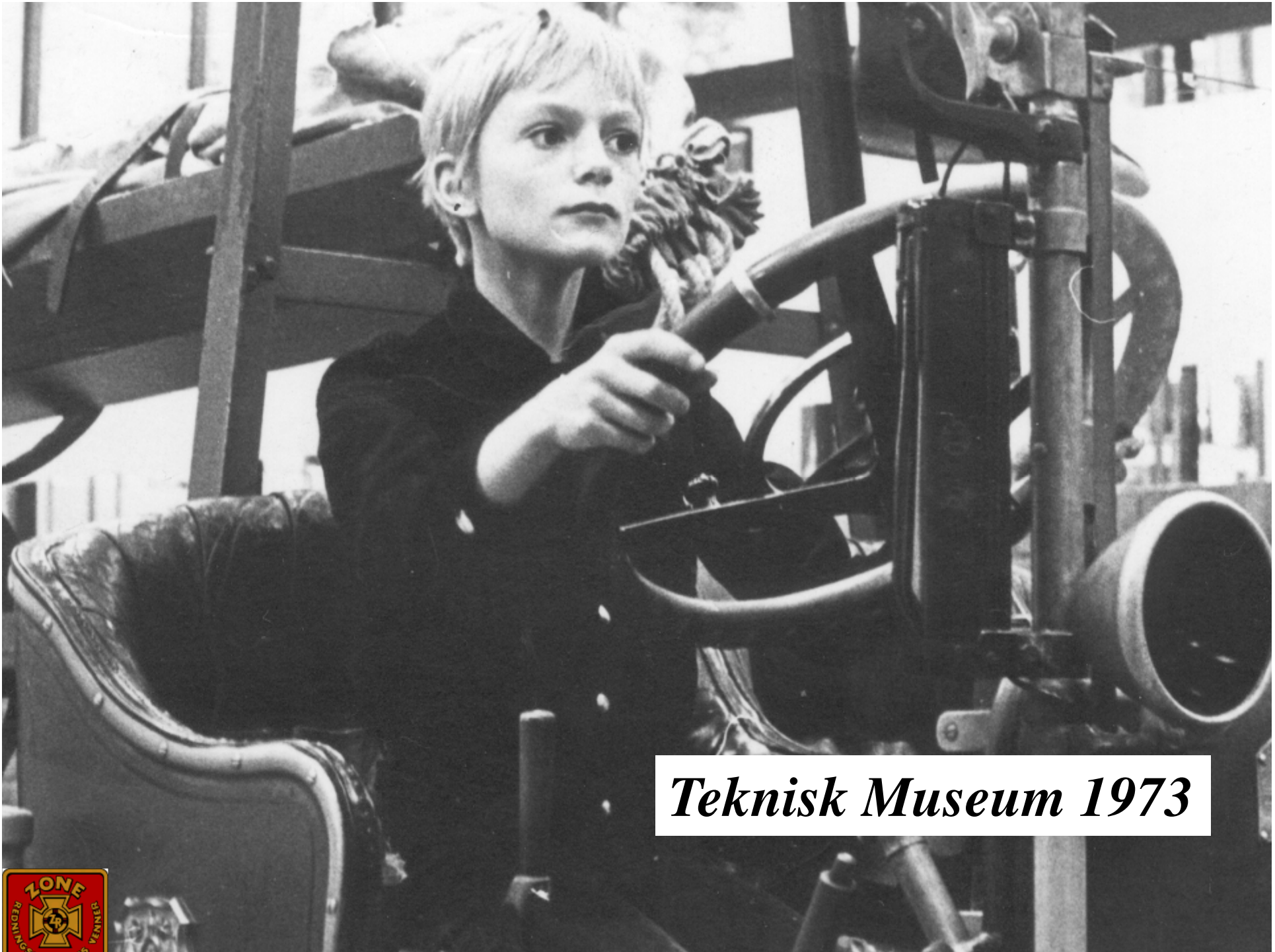
Teknisk Museum 1973