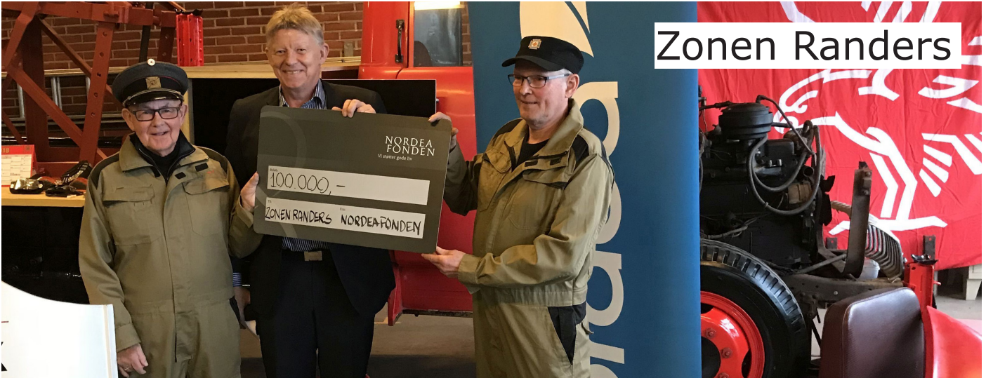
Zonen Randers modtog ved nytårsparaden 2018 kr. 100.000 fra NordeaFonden

Vi har i det sidste års tid forsøgt at orientere medlemmerne om, hvad vi går og laver i garagen, og hvad der ellers sker i foreningen. Vi har lavet et "Garage-Nyt" en gang om måneden, og fundet billeder fra den forgangne måned.