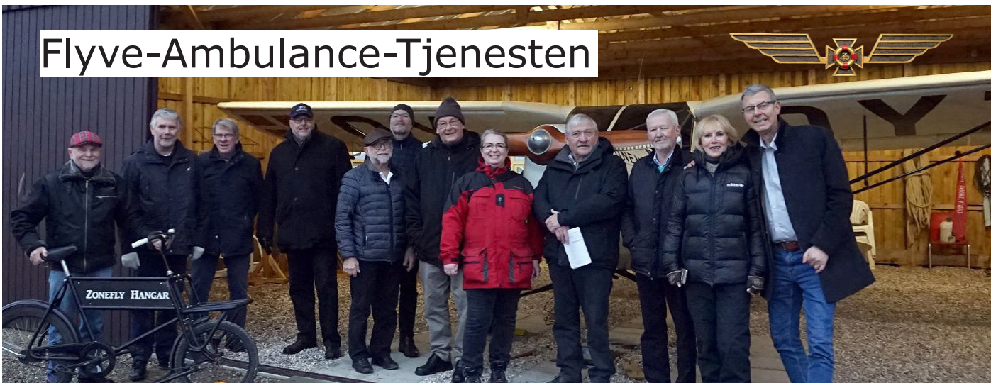
Besøg i hangaren med KZ-III ambulance-maskinen i forbindelse med fly-gruppens julearrangement 2018