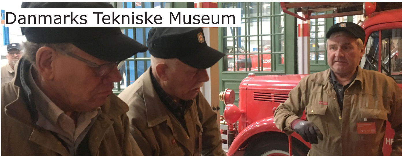
Medlemmer af Zone-Gruppen i Helsingør drøfter opgaven med at få motoren på Opel katastrofevognen repareret