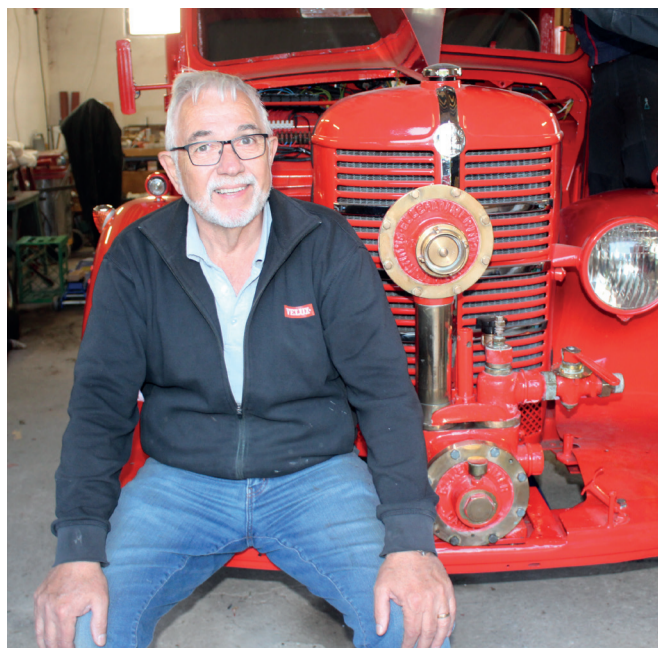
"Fiffer" er gammel smed og ser, at styrken ved mandskabet er deres forskellige baggrund.