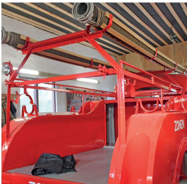
Brandsprøjten er delvis bygget af træ, som er blevet udskiftet, lige som der er banket rust i stor stil.