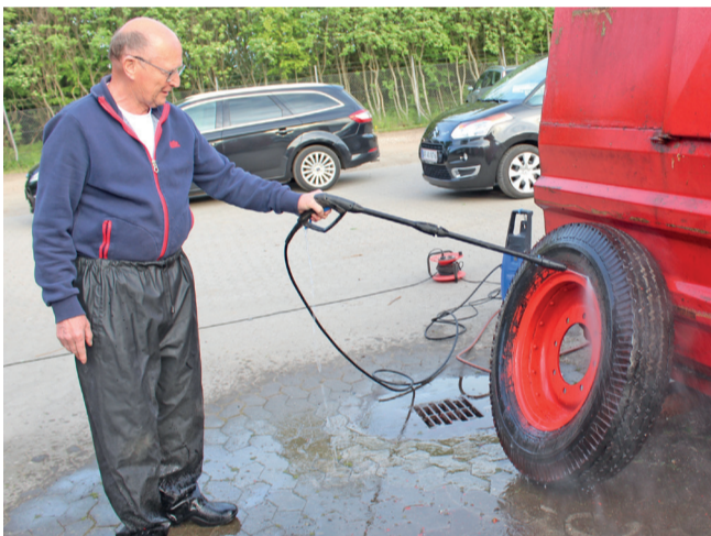
Uffe i gang med at rengøre et hjul.

- Falck blev dannet i 1906 som Danmarks første redningskorps. I 1930 bryder Zone-Brand-Vagten og Redningskorpset på Falster med Falck og tager navnet Zone-Redningskorpset. Efter at have konkurreret i 33 år slutter de to korps sig sammen som Falck-Zonen. Fra 1977 hedder korpset igen kun Falck. - Yderligere information om Zonen, se www.zone-redningskorpset.dk .