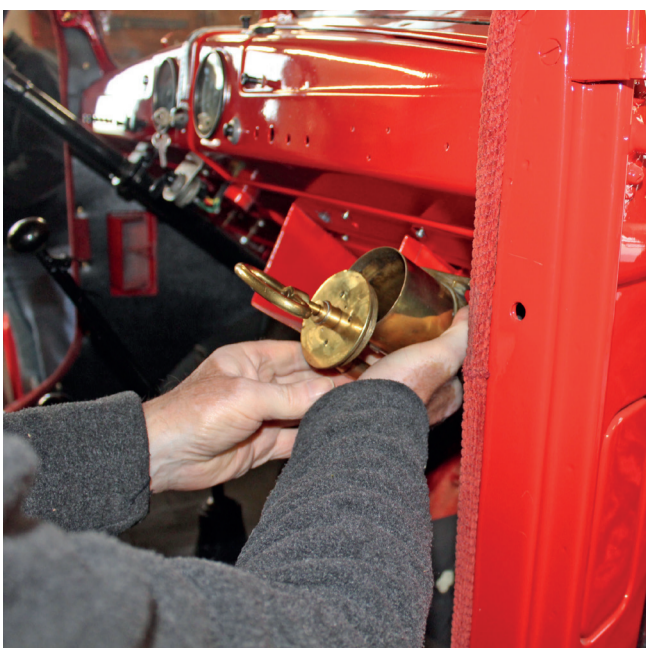
Pumpe, som får hornet til at sige babu

Det samme gør i øvrigt også Børge, der tillige kører med pensionister. Begge stopper dog til sommer som chauffører. - Vognmanden fik ikke