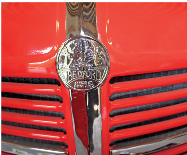
Zone sprøjten skinner som var den fabriksny