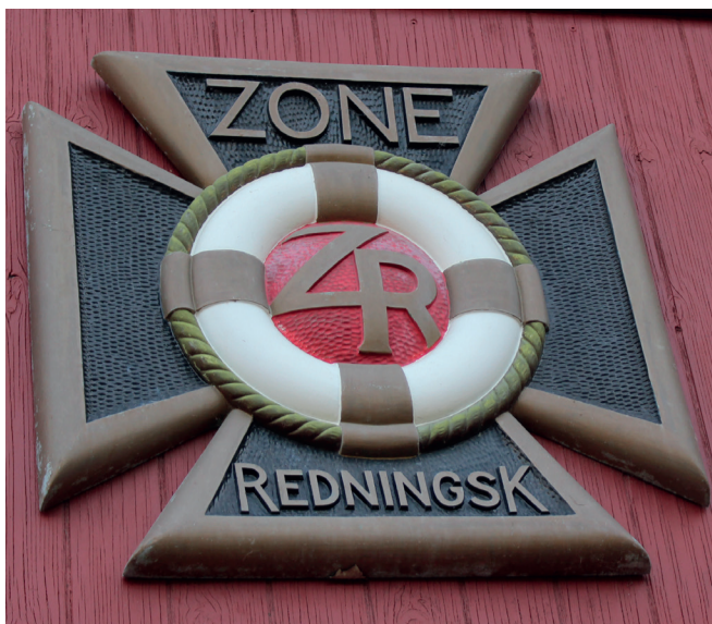
Det synlige bevis, at der her er tale om en Zone-station.