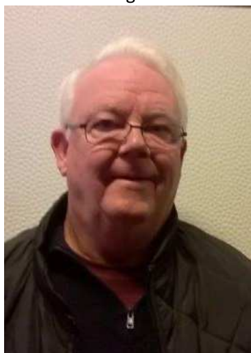
Tom (hushovmester og fotograf)