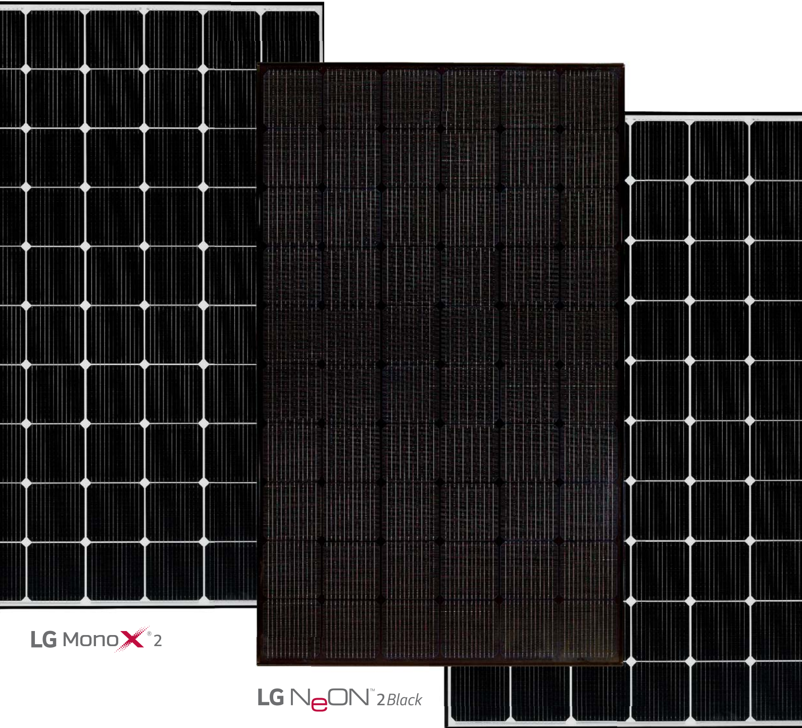
LG MonoX ® 2