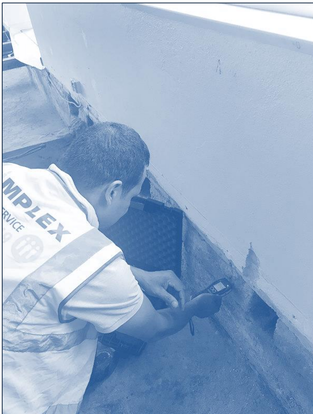
Fugtmåling foretaget af Zimplex Facility Service