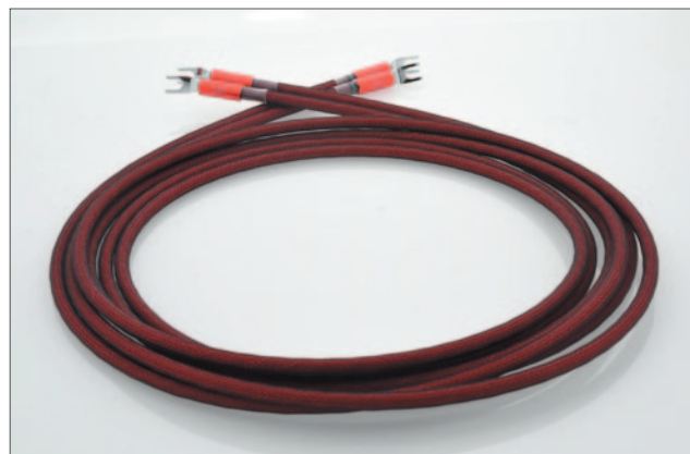
ZenSati Zorro 喇叭線 (3m) ■售價：HK$17,224 / 對