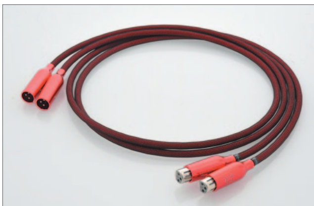
ZenSati Zorro XLR 平衡訊號線 (1.5m) ■售價：HK$10,474 / 對