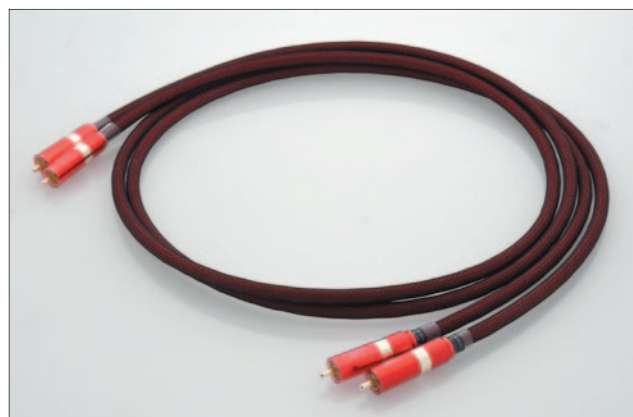
ZenSati Zorro RCA 訊號線 (1.5m) ■售價：HK$10,474 / 對

■總代理：Sound Concepts Ltd · 23863113 ■試音處：聲之島 · (中區) 25241881