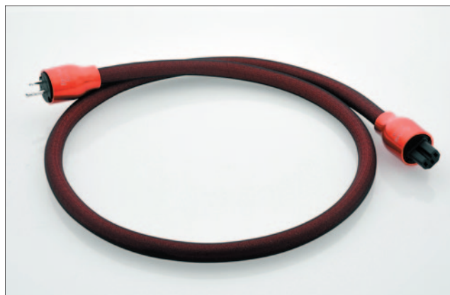
ZenSati Zorro 電源線 (1.5m) ■售價：HK$13,034