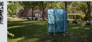
Blue Mind Miia Kettunen

RYDEBÄCK Ytterövägen mittemot restaurang Tegel / Helsingborg Material: Cyanotypi på bomullsduk, trä, stål