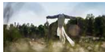
How to Explain Humans to a Dead Artwork Karon Nilzén

TRANEMO, vid Tranemojön nedanför Centralen Material: Textil, trä, växtdelar, funna material