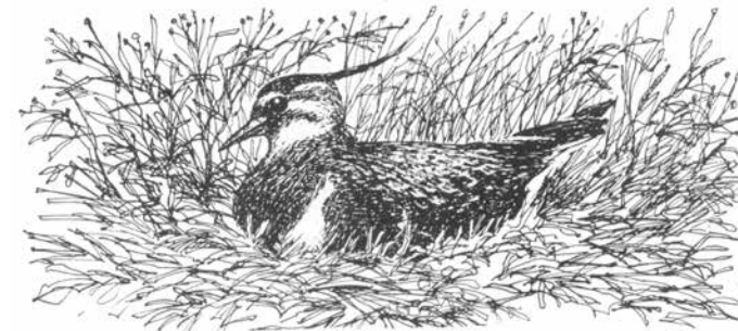
Viben yngler helst på steder med lave planter, f.eks. en afgræsset eng

Naturpleje på overdrev og enge udføres mange steder ved hjælp af kvæg og får. På statens arealer græsser det hårdføre "skovkvæg", der også bruges i Mols Bjerge, mens andre arealer afgræsses af forskellige typer kvæg i privat eje. Naturens udvikling følges nøje, ikke mindst i sårbare områder med f.eks. orkideer. Her er det særlig vigtigt, at plejen udføres, så de sjældne planter bevares.