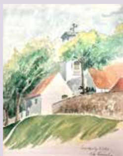
Illustration: Ole Finnerup