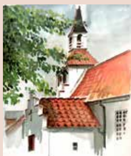
Illustration: Ole Finnerup

Vi ønsker alle en rigtig glædelig jul og et godt nytår.