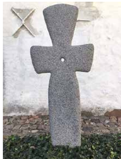
Keltisk kors ved Bregninge Kirke.

Det er til eftertanke for os alle, der er vandrere i Vor Herres natur i medvind og modvind; vores kirker på Ærø er grønne kirker, og det kan vi hver dag indtænke i vores praksis, forkyndelse og kristendom.