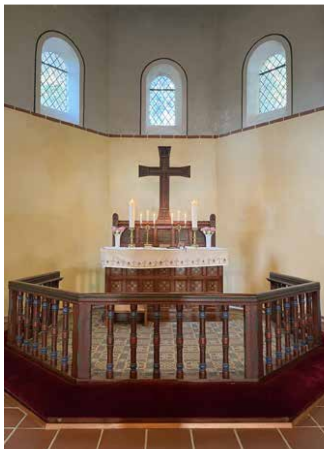
I 2024 går vi i gang med at male i koret og præsteværelset samt foretage andre småreparationer.

Den 6. maj 1894 blev kirken indviet. Budgettet havde holdt, så der kunne også anskaffes et lille harmonium. Ti år senere blev harmoniet afløst af Marstal Kirkes orgel fra 1870'erne. Dette orgel blev gennemgribende ombygget i 1928 og i 1983 erstattet af det nuværende orgel, hvor blot mixtur-stemmen blev tilføjet. Det øvrige pibemateriale stammede fra det gamle orgel. Malermester Pofler fra Marstal malede kirkens karakteristiske farver og mønstre, som den dag i dag giver kirken det særlige indtryk af en nordisk stavkirke, selv om kirken uden på ligner en traditionel dansk landsbykirke i røde sten.