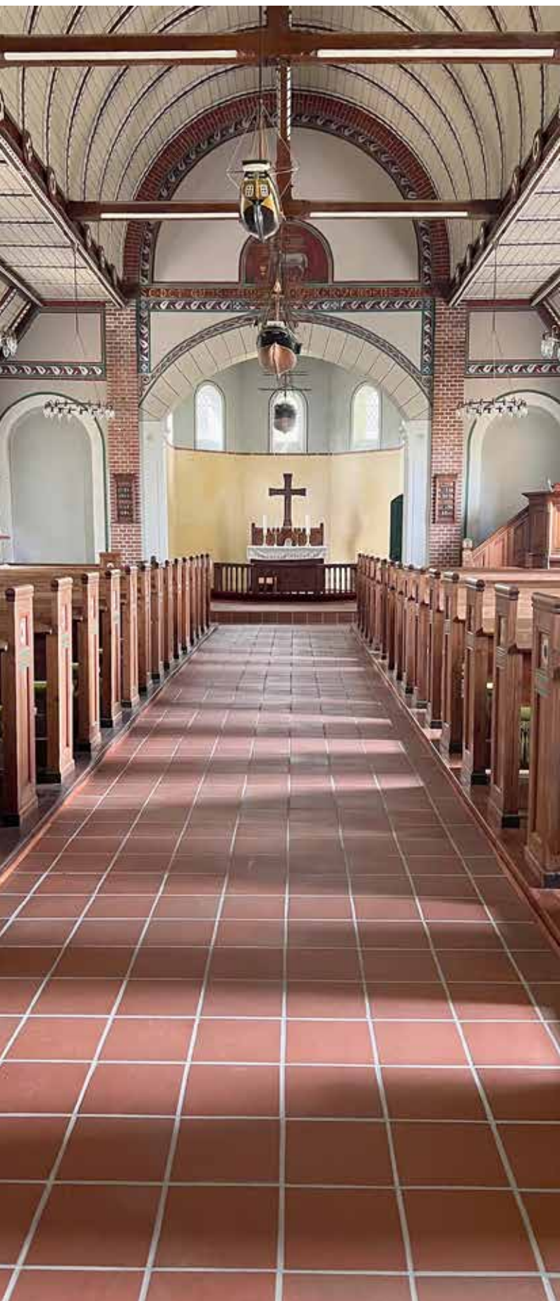
Første projekt var at udskifte tæppet i midtergangen. Tæppet gav nemlig en muggen lugt i rummet. I 2023 har vi udskiftet tæppet med et smukt teglgulv, der går ned gennem kirkerummet og i koret. Det har væsentligt forbedret indeklimaet.

ceringen gav god mening. Den gang hørte skole og kirke sammen.