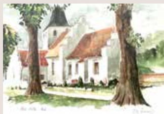
Illustration: Ole Finnerup

På Folkekirkens Nødhjælps vegne: Marietta Larsen