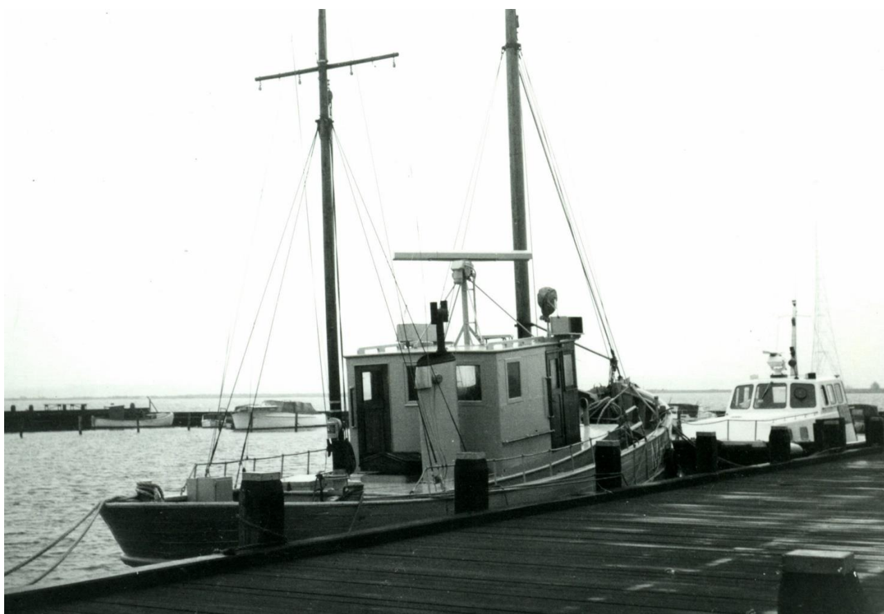
Herover: Flotille 251's første skib, trækutteren MHV 53, ved kaj 1 i Kalundborg vesthavn i 1975. I baggrunden ses lodsåden PILOT.

Gamle MHV 53 kunne kun gøre sig håb om at observere og melde om WAPA- skibe, når disse passerede i farvandet ud for Kalundborg fjord. Med en topfart på kun 8-9 knob, kunne man ikke gøre sig nogen forhåbninger om at følge efter dem.