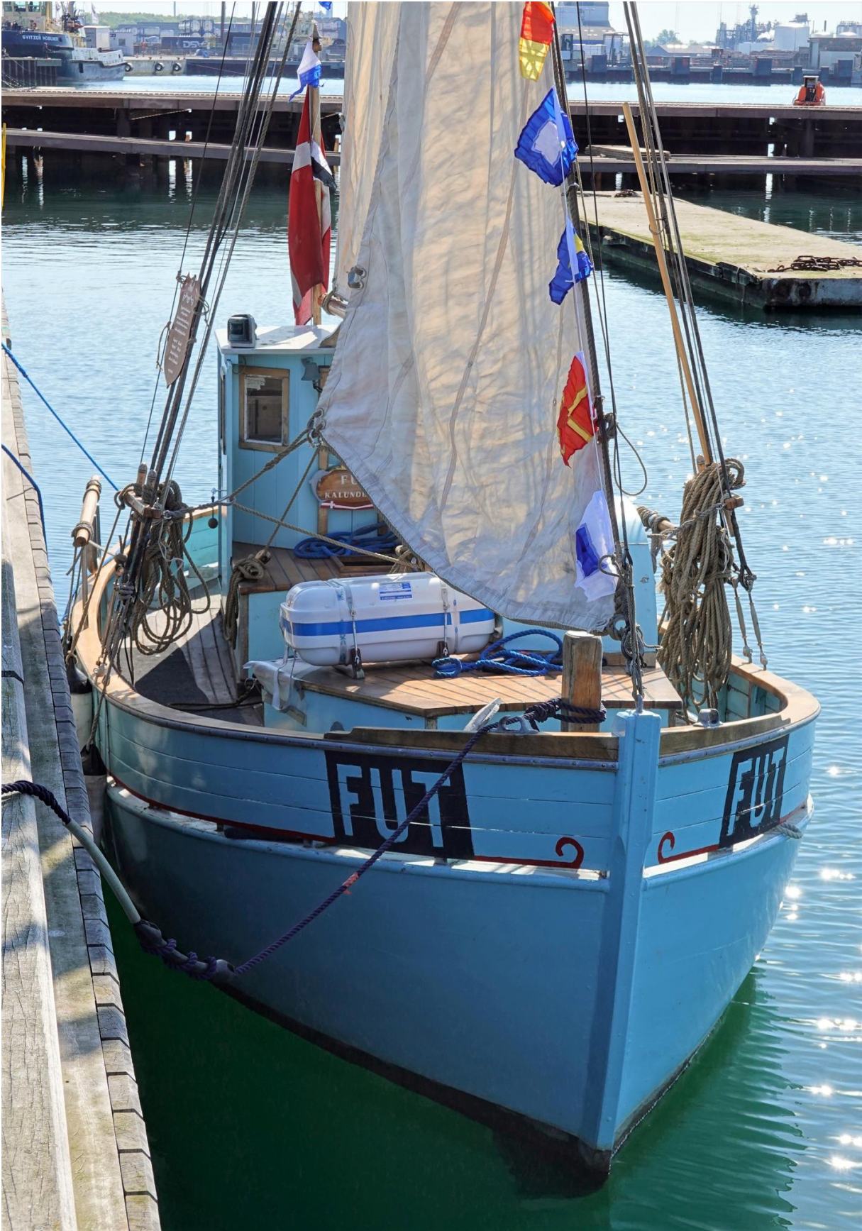
Herover: Kutteren FUT som også deltog i arrangementet. Kutteren fremstår i meget flot stand.