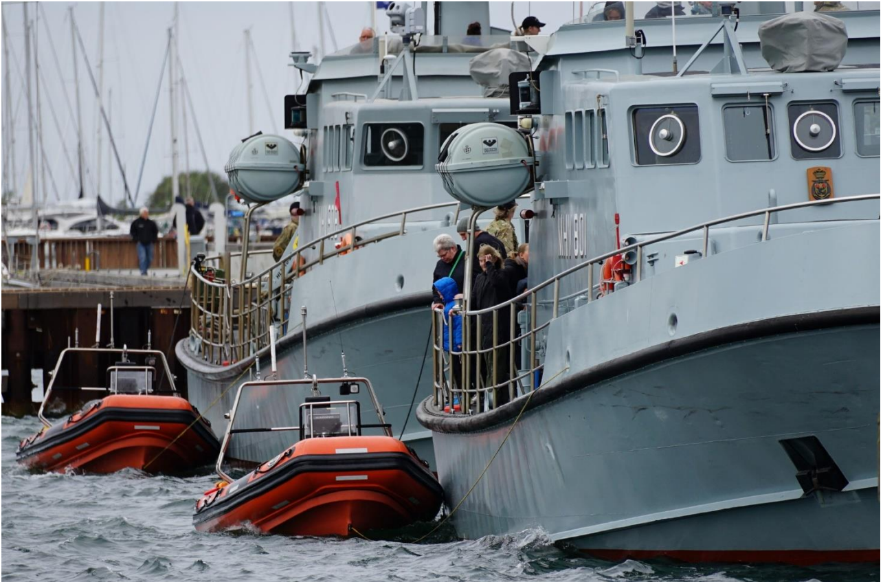
Herover: Marinehjemmeværnsfartøjerne MHV 801 ALDEBARAN og MHV 908 BRIGADEN ved dagens Os I Uniform arrangement i Kalundborg gl vesthavn i dag.