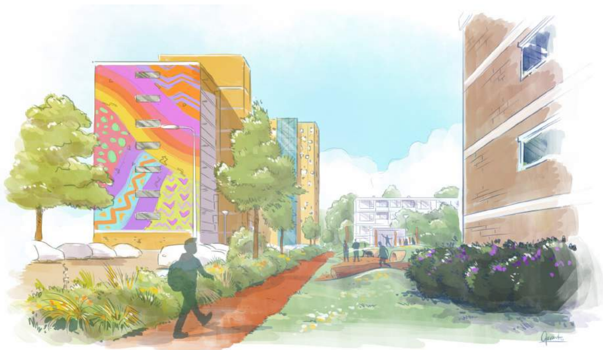
Impressie Samen vormen verschillende speelplekken één speelparcours langs de Dotterlei

Er moeten fijne en veilige wandelroutes zijn tussen de basisscholen, de winkels, het buurtpark en de woningen. Daarom gaan we onder andere de oversteekplaatsen voor voetgangers en fietsers op de Schenkelse Dreef veiliger maken en op logische plekken aanleggen. Dat doen we als onderdeel van een nieuwe inrichting van de Schenkelse Dreef in de Florabuurt. Ook verbreden we de fietspaden en platen we bomen aan de oostzijde van de weg.