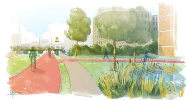
Impressie De verbinding naar het metrostation verbeteren

"Twee jaar geleden hebben wij een woning gekocht in de Florabuurt. Ik weet nog goed dat sommige vrienden ons eerst wel wat raar aankeken toen we dat vertelden. Zij kenden nog de oude verhalen over de buurt. Maar we wonen hier met veel plezier! We hebben een heerlijk dakterras bij ons appartement, maar we fietsen ook in een paar minuten naar het prachtig opgeknapte Schollebos. Zelf werk ik in het centrum van Rotterdam en de metro om de hoek is echt perfect. Als het mooi weer is pak ik natuurlijk de fiets. We hebben onze auto vorig jaar weggedaan omdat we die nog maar zelden gebruikten. En er zijn voldoende deelauto's te vinden in de buurt voor als we wel een keer een auto nodig hebben. De buurt is de afgelopen jaren echt veranderd."