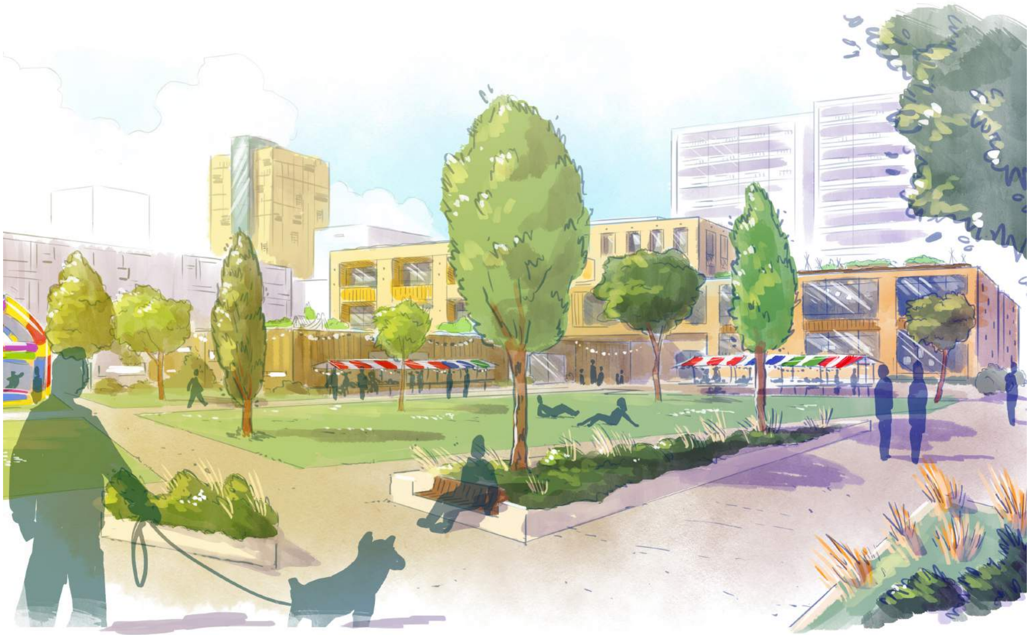
Impressie In het midden van de Florabuurtt komt een nieuw buurtpark. Het wordt dé ontmoetingsplek voor de Florabuurtt.