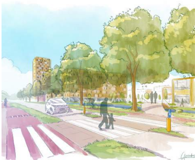
Impressie Veilig de Schenkelse Dreef oversteken