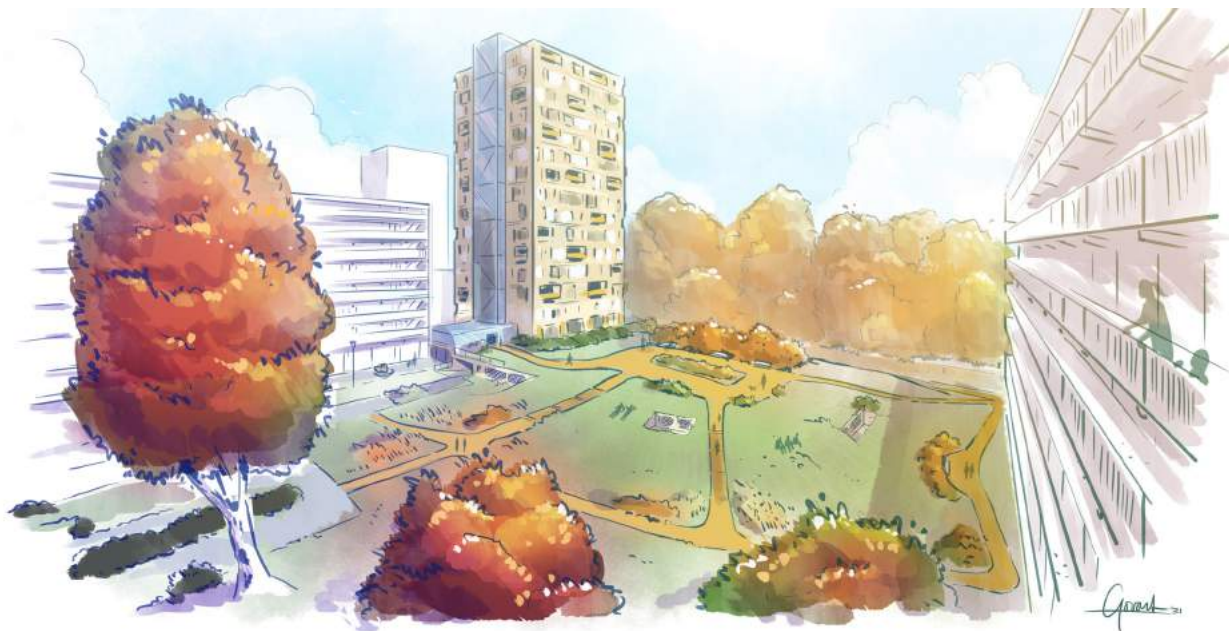
Impressie Bij het IJsselland Ziekenhuis aan de Dotterlei zien we mogelijkheden om ongeveer 60 appartementen te bouwen.

De meeste nieuwe woningen bouwen we in het middengebied. Hier is ruimte voor maximaal 260 woningen. De randvoorwaarden voor deze ontwikkeling liggen vast in het Gebiedspaspoort Middengebied Florabuurt. Aan de Wingerd zien we mogelijkheden om 8 woningen te bouwen. Dit willen we verder verkennen in combinatie met de mogelijkheid om groen toe te voegen aan de Wingerd. De randvoorwaarden hiervoor leggen we vast in een nog op te stellen Kavelpaspoort Wingerd. Op de hoek van de Florabuurt bij het IJsselland Ziekenhuis aan de Dotterlei zien we mogelijkheden om ongeveer 60 appartementen te bouwen. Tot in ieder geval 2027 worden er geen woningen aan de Dotterlei gebouwd. Naar verwachting zijn in 2027 het kindcentrum en de woningbouw in het middengebied gereed. Pas hierna wordt een definitief besluit genomen over woningbouw aan de Dotterlei.