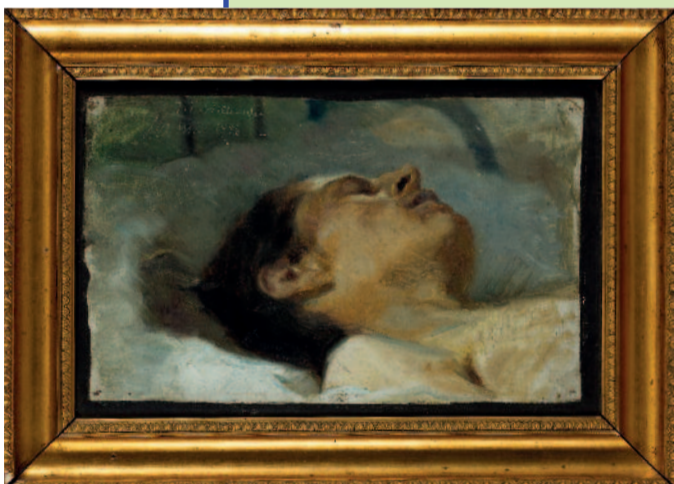
HOVED AF EN DØD SOLDAT PÅ GARNISONS SYGEHUS. 1886. OLIE PÅ LÆRRED. 25,3 X 41 CM