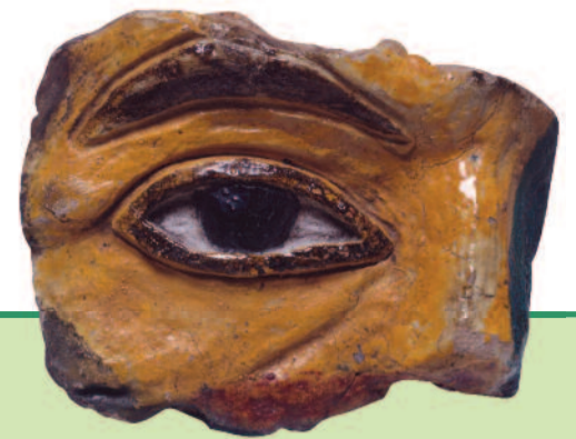
ET ØJE. KERAMISK PRØVESTYKKE. 1891. CLASERET LERTØJ. 9 X 11 CM.

Som kunstner kunne Willumsen også iscenesætte de mennesker, han malede portrætter af. Han klædte dem ikke ud eller oprettede profiler på internettet, men brugte forskellige malemåder, farver og former.