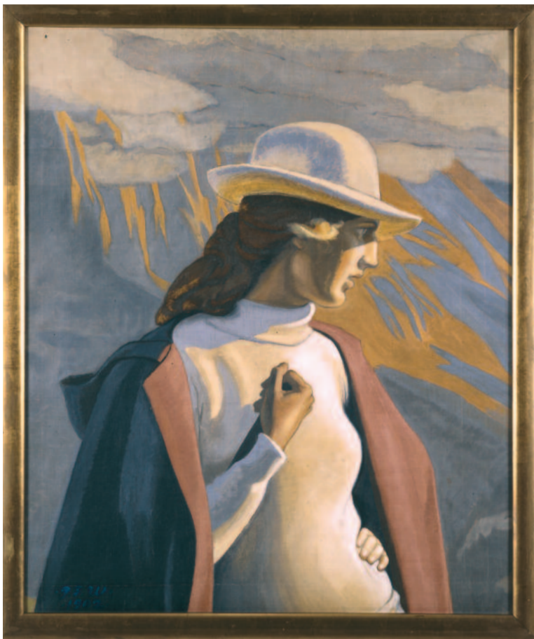
BJERGESTIGERSKE. SKITSE. 1902. TEMPERA OG OLIE PÅ LÆRRED. 93,5 X 77,5 CM