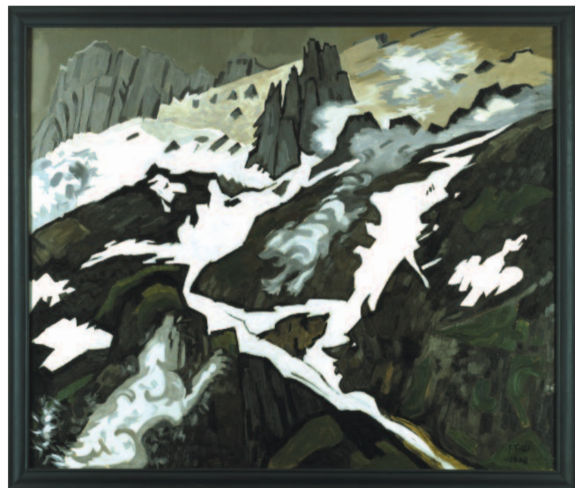
TÅGER OG SNEKLATTER PÅ ET BJERG. 1938. OLIE PÅ LÆRRED. 127 X 150 CM