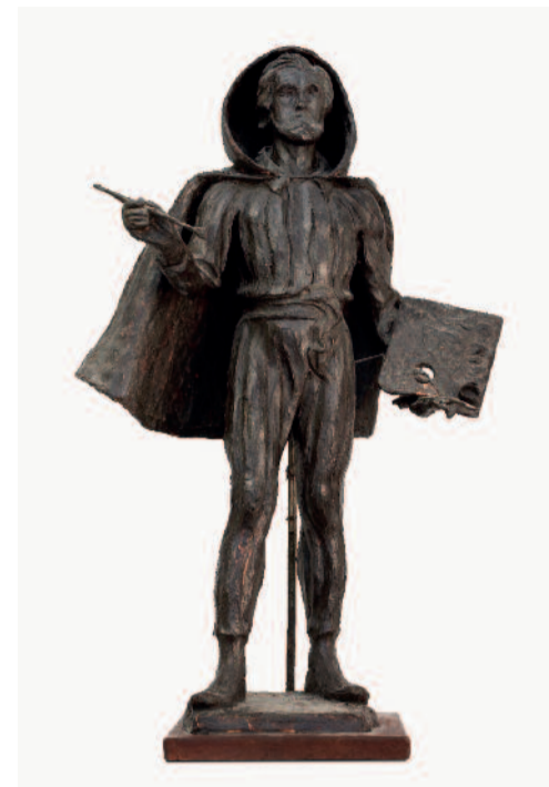
EN STATUE AF KUNSTMALEREN, SKITSE, 194-1, VOKS OG GIPS, HØJDE 72,5 CM

Willumsen lavede også en skitse i voks til en statue af sig selv.