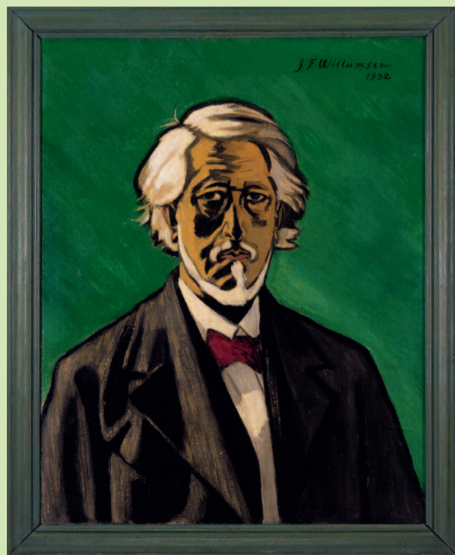
SELVPORTRÆT. 1932. OLE PÅ LÆRRED. 92 X 73 CM.