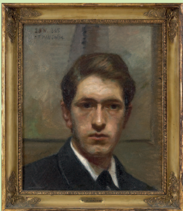
SELVPORTRÆT. 1885. OLE PÅ LÆRRED. 41 X 34 CM.

Da Willumsen var 22 år, malede han sit eget portræt. Det kaldes et selvportræt . Vi kan se, at han har hvid skjorte og sort jakke på. Hans ansigt er alvorligt, og han kigger direkte på os.