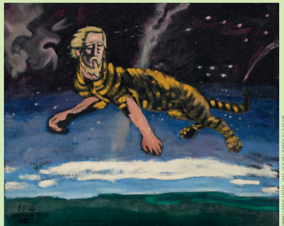
HIMMELGÅDEN. SKITSE. 1936. OLIE PÅ LÆRRED. 54 X 65 CM