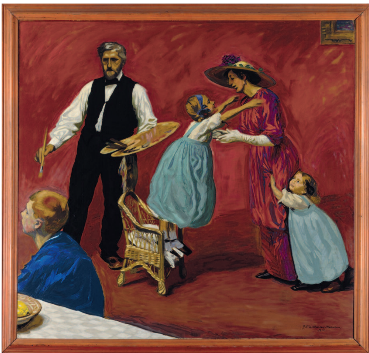
MALEREN OG HANS FAMILIE, 1912, OLIE PÅ LÆRRED, 230 X 245 CM