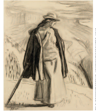
EN BJERGESTIGERSKE. KOMPOSITIONSSKITSE. 1913. KUL OG SORTKRIDD PÅ PAPIR. 48,2 X 39 CM

I 1901-1902 var Willumsen og Edith på rejse sammen i Alperne, og Willumsen fik idéen til et stort portræt af Edith, hvor hun skulle stå i det mægtige bjerglandskab. I hans tegnede skitse kan vi se, hvordan han forestillede sig, at det store billede skulle se ud. Tegningen viser det, man kalder billedets komposition . Han malede også en skitse med Ediths ansigt og overkrop. Hendes hoved er drejet i profil . I baggrunden ser vi landskabets bjerge. Hun har en lys hat og rullekravesweater på, og en løs frakke hænger på hendes skuldre. Med højre hånd støtter hun sig til en vandrestav. Den venstre hånd hviler på hofte.