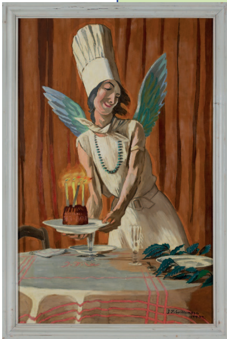
FØDSELSDAGSKAGEN. EN SPØG. 1943. OLIE PÅ LÆRRED. 149 X 91 CM