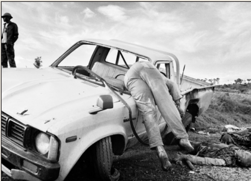
Jan Grarup: Folkedrabet i Rwanda/april 1994. Tutsier dræbt efter flugten fra Kigali. Hovedvejen mellem Kigali og den tansanianske grænse.

Diskutér med din sidemand, hvor langt, du mener, man kan gå. Er der noget, man ikke kan vise?