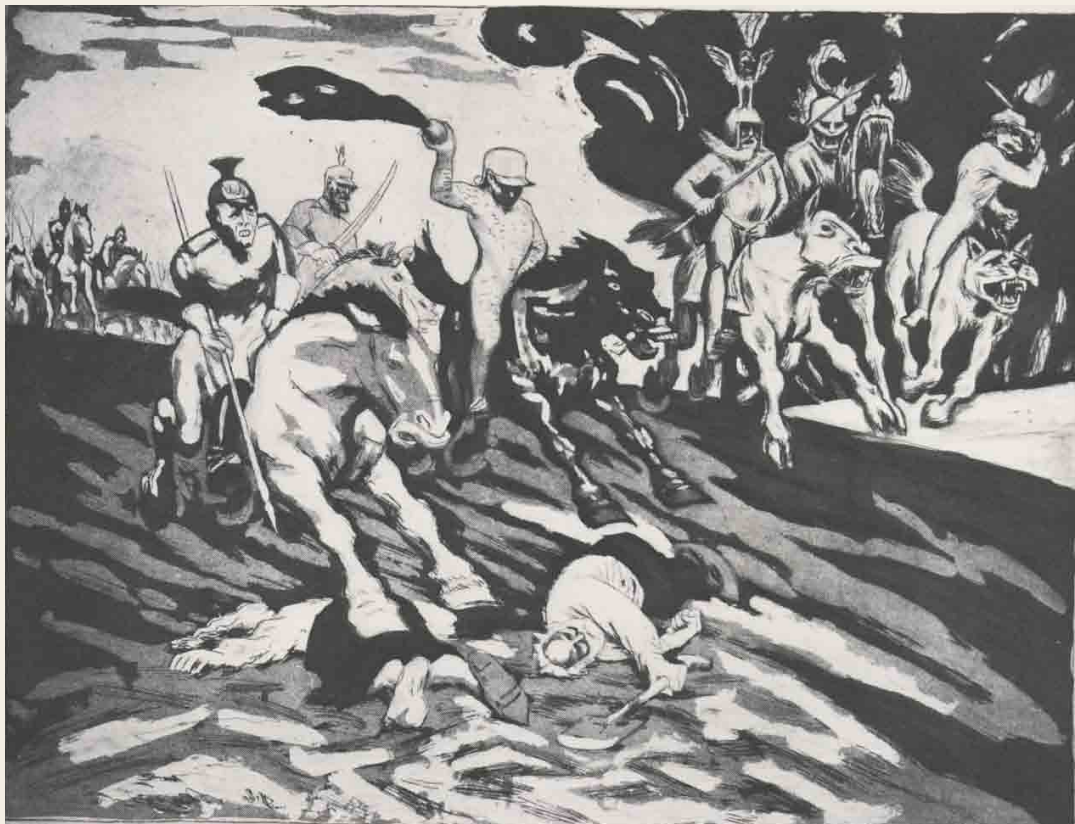
J.F. Willumsen: Invasionen , 1917

Willumsen arbejdede med flere forskellige trykteknikker, der alle krævede stor præcision, teknisk dygtighed, tålmodighed og mange forsøg og tilrettelser før det færdige resultat var klar.