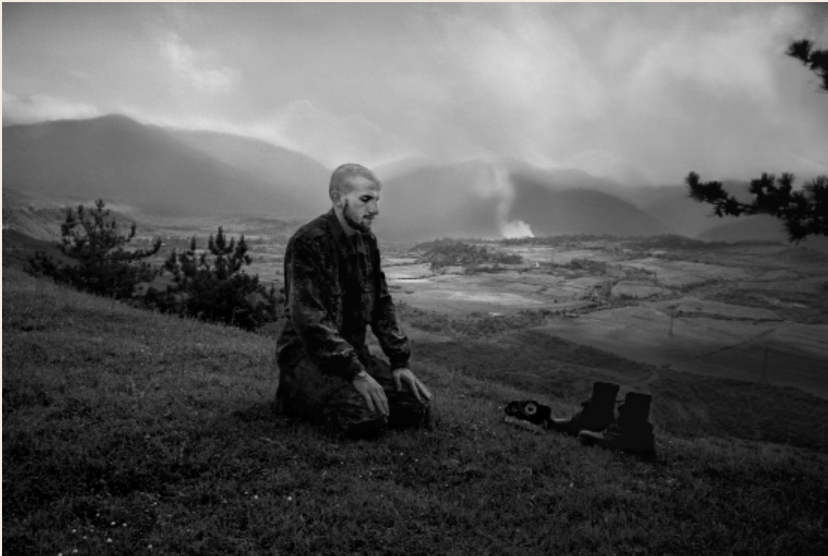
Jan Grarup: Kosovo/1999

Willumsens værker kan kaldes synteses mellem historiske fakta og personlige indtryk og fortolkninger af virkeligheden, som omsættes til et kunstværk. Grarups fotografier har et andet nært forhold til virkeligheden, fordi motiverne er direkte afftryk fra virkelige hændelser. Ofte opfattes fotografier også som mere sande og tættere på virkeligheden. Fotografiet er et indfanget øjeblik af en større sammenhæng, så det gælder om at indfange netop dét øjeblik, der kan rumme en hel fortælling. Men på trods af sit nære forhold til virkeligheden fortæller fotografier dog aldrig bare én sandhed. Fotografiet er også udtryk for fotografens subjektive holdning, til- og fravalg og fortolkning af en situation. Hos Grarup er der sjældent en billedtitel. Derimod ledsages fotografierne af en beskrivende tekst, der placerer fotografiet i en større kontekst. Vi har ingen mulighed for at vide om denne beskrivelse er sand, men vi må dog som udgangspunkt stole på fotografen. Teksten betyder, at vi aflæser fotografiet på en bestemt måde og dermed tillægger det en særlig betydning. Teksten kan således påvirke vores opfattelse og sympati for det, der sker på billedet. Ordet kan på den måde bestemme, hvordan og hvad vi ser på billedet.