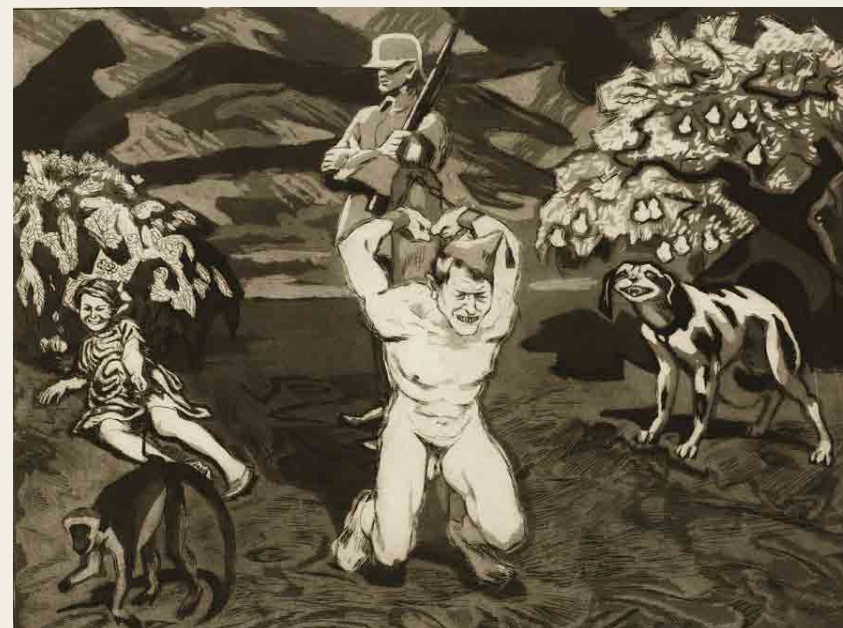
J. F. Willumsen: Den belgiske fange , 1918.