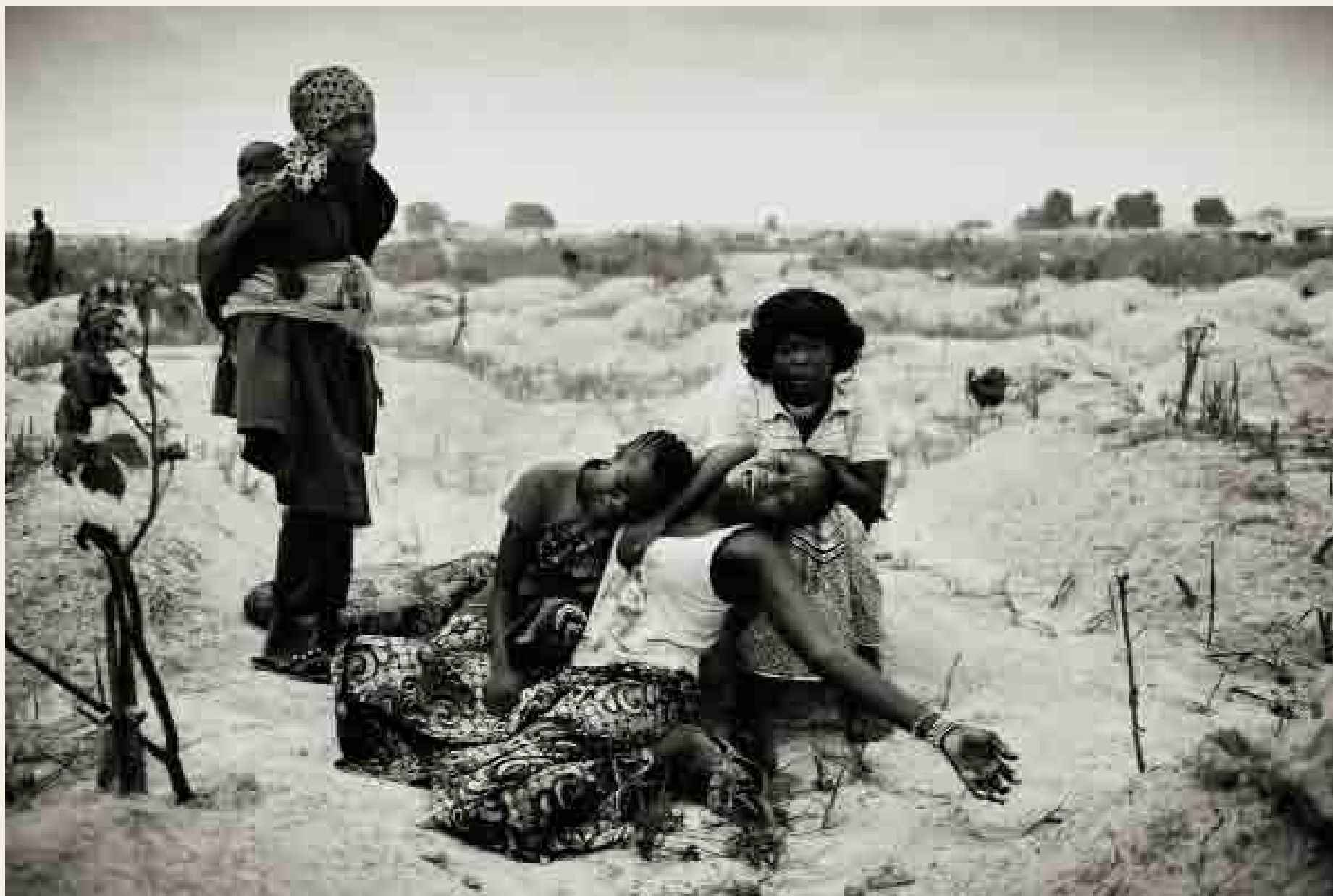
Jan Grarup: Konflikten i Den Centralafrikanske Republik/ 2014. Familien til en ung mand, der blev skudt og dræbt da chadianske MISCA-styrker gik på jagt efter anti-balaka krigere.