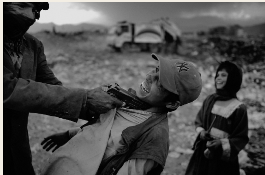
Jan Grarup: Kabul, Afghanistan/2012. Dreng, der leger med en legetøjspistol, de har fundet på en losseplads i udkanten af Kabul.

Er der forskel på at vise krigen i et kunstværk og at vise krigen i et fotografi?