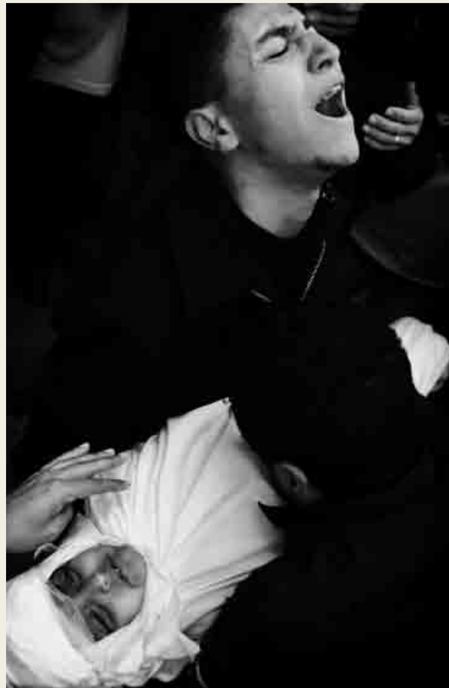
Gaza/2008-2009. Operation Cast Lead. Israelsk Militærøffensiv i Gaza.