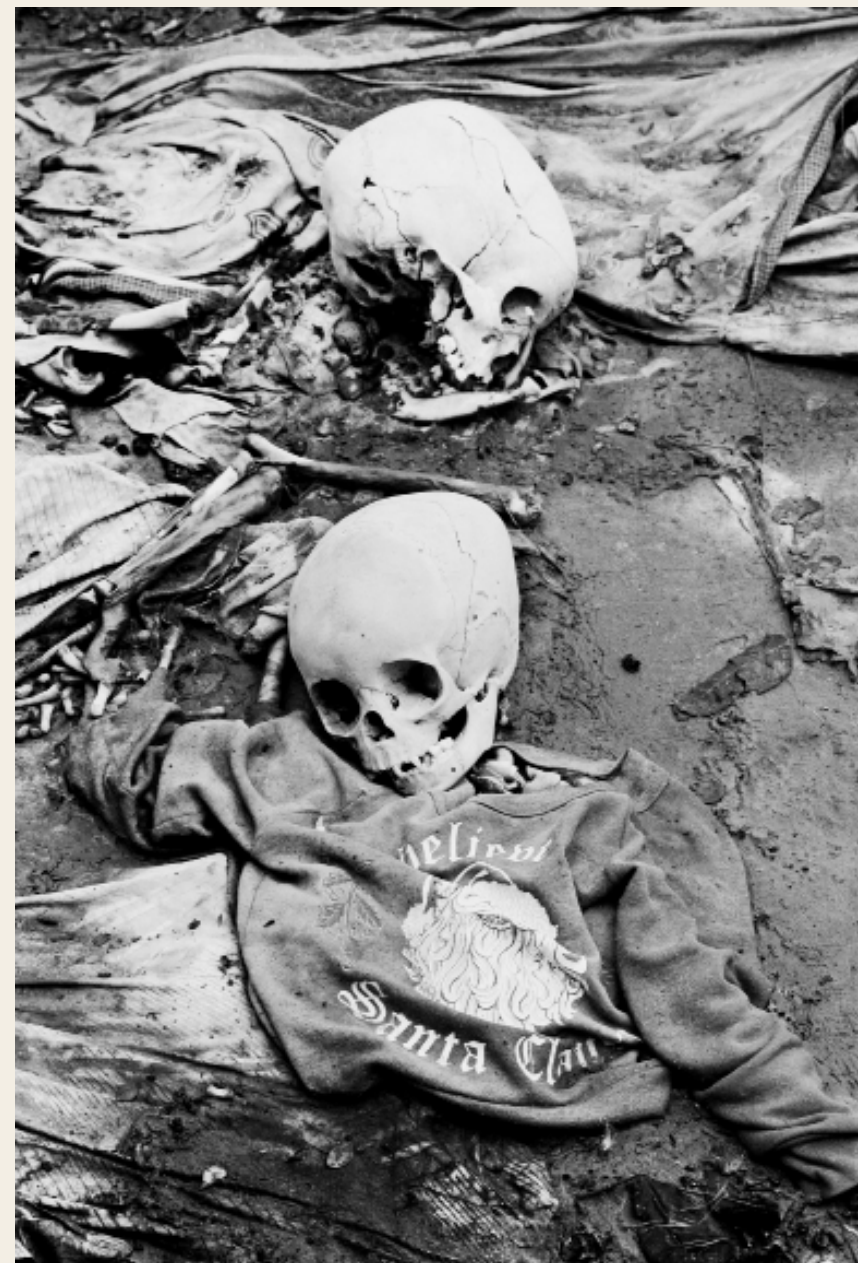
Jan Grarup: Folkedrabet i Rwanda/april 1994. Ligene af små børn, som blev dræbt i et checkpoint i udkanten af Kigali.

Hvordan synes du, at det sort/hvide udtryk påvirker billedets motiv? Ville vi betragte det på en anden måde, hvis billedet var i farver?