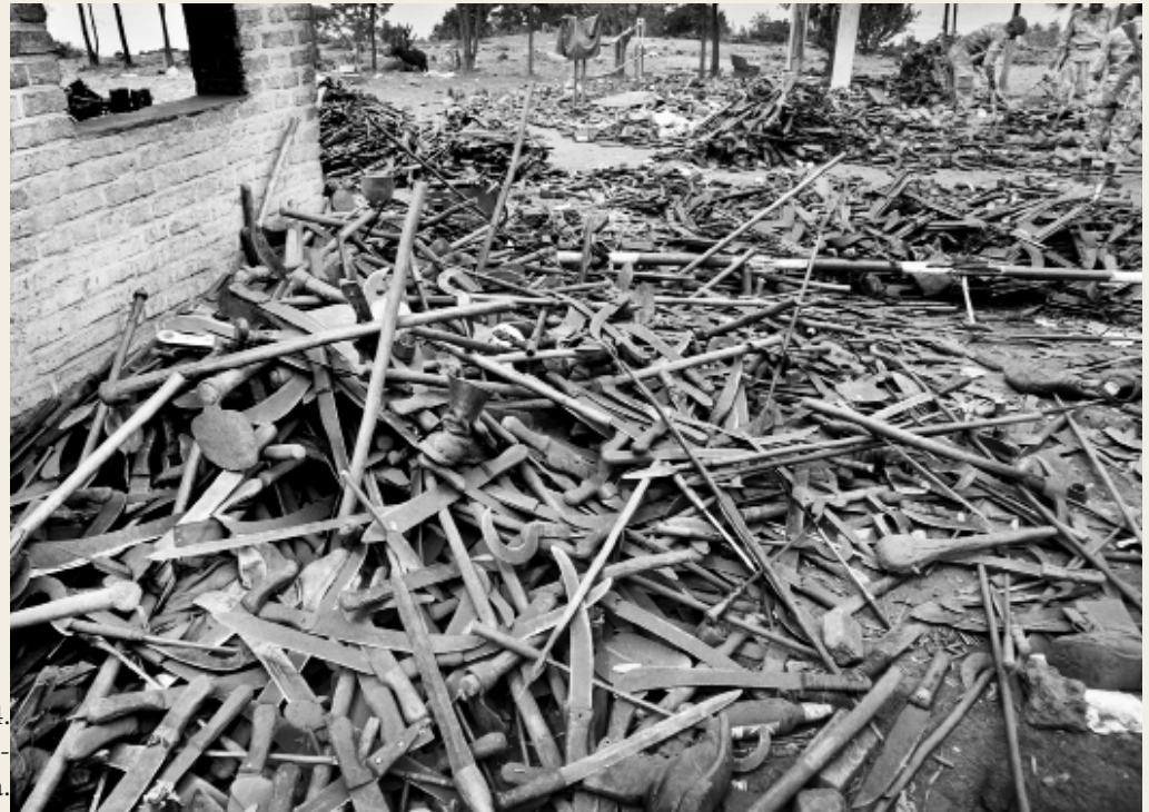
Folkedrabet i Rwanda/april 1994. Efter Tutsiernes modangreb flygtede tusinder af hutuer til Goma i Zaire, inklusiv militmedlemmer, der havde stået bag massakrer på tutsier. Deres våben blev efterladt i Rwanda.

"How do you explain to traumatised sudanese women queuing with their undernourished children in Darfur that there is a difference between "acts of genocide" and actual genocide" Citat af Jan Grarup fra bogen "Shadowland".