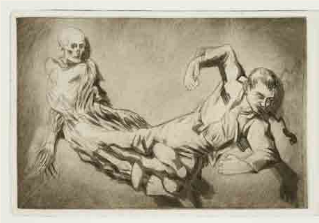
J. F. Willumsen: To døde soldater , 1917.