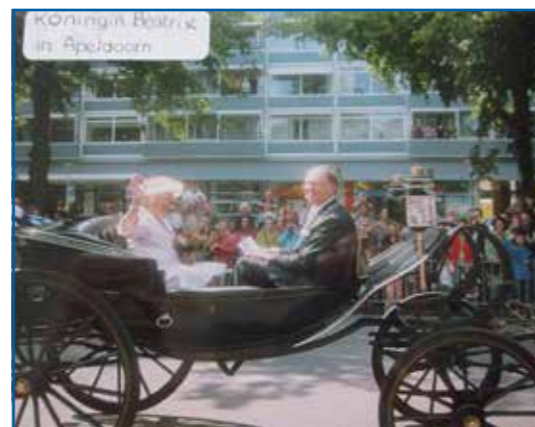
Bezoek koningin Beatrix aan Apeldoorn, 13 augustus 2005. Rijtoer ter hoogte van de Grote Kerk.

Op deze pagina treft u er enkele aan en in de toekomst zullen we er nog wel eens op kunnen terugvallen. Het hoeft geen uitleg dat we ook na vandaag nog geïnteresseerd blijven in nieuwe inzendingen van interessante foto's van onze wijk. Dat mag in digitale of analoge vorm. Het digitaliseren hiervan is met de huidige stand der techniek geen probleem meer. En in het denkbeeldige geval dat u afstand wilt doen van de foto's: wij gaan als wijkraad niet zelf een verzameling aanleggen, maar bemiddelen desgewenst graag bij het vinden van een verantwoorde bestemming.