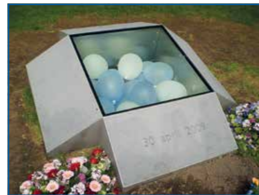
Het monument ter herinnering aan de aanslag

In 2010 werd voor deze gebeurtenis ook een monument onthuld, dat zich aan de overkant van de kruising schuin tegenover De Naald bevindt.