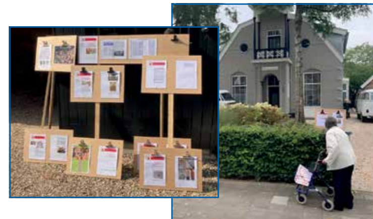
Impressies van de Burendag in de Indische buurt, 25 september 2021.