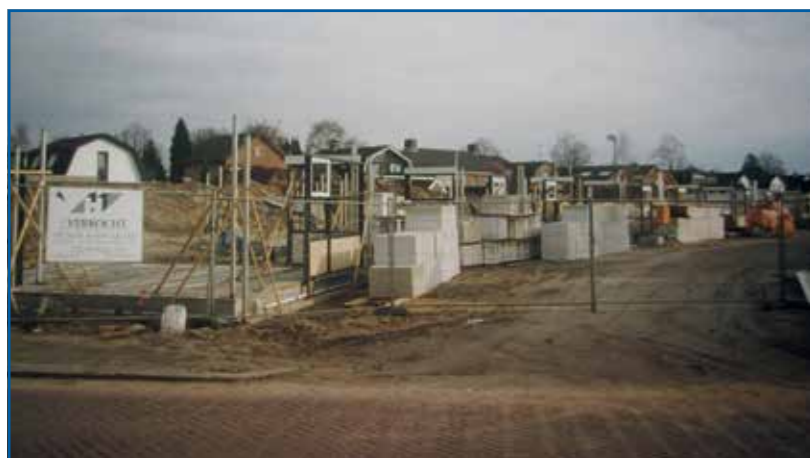
De Middenhof in aanbouw, 1996.

Naast die min of meer bekende beelden moeten er ook foto's bestaan die niet iedereen kent. Want ook mensen zoals u en ik maakten en maken foto's. Die komen meestal niet naar buiten, maar slijten in plaats daarvan hun leven in de beslotenheid van het familiealbum, de schoenendoos met oude fotonegatieven of de oude diadozen in het boekenrekje op de logeerkamer. Die kunnen zich overal op deze aardbol bevinden, maar onze eigen wijk levert vanzelfsprekend een verhoudingsgewijs grote vangkans voor verborgene schatten van juist dit specifieke stukje Apeldoorn op. En inderdaad: mijn oproep leverde een paar typische voorbeelden van zulke foto's op.