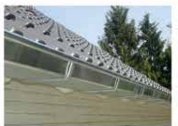
LOOD- EN ZINKWERKEN