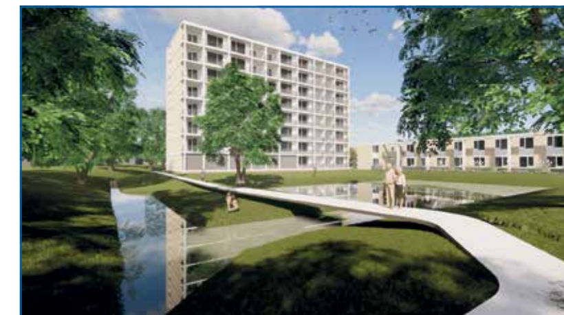
Artist's impression van De Zuiderhoek en De Gemzen

De Gemzen is voorzien van een ruime recreatieruimte voor bewoners, waar gezamenlijke activiteiten kunnen plaatsvinden. De door Vèrian georganiseerde dagbesteding voor bewoners is veelzijdig en varieert van samen koffiedrinken tot creatieve activiteiten, geheugentraining of bewegingsspelletjes. Bij mooi weer kan er buiten gezeten worden op het aan de recreatieruimte grenzende terras.