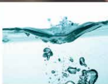
GAS - WATER