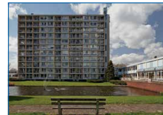
De Veenkamp in 2013

Bij de appartementen in De Gemzen biedt zorgaanbieder Vèrian zorg en ondersteuning. De eenheden meten circa vijftig vierkante meter en zijn hiermee een stuk ruimer opgezet dan die in De Veenkamp. Dankzij het formaat van de appartementen zijn deze ook geschikt voor echtparen.