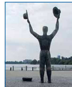
Het bevrijdingsmonument in Apeldoorn (links) en het tweelingmonument in Ottawa