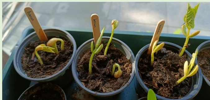
Bonen kweken, eerst in de vensterbank en later in het voorjaar in de grond buiten.

In de appgroep 'Peperplanters' was het kweekproces goed te volgen. De deelnemers wisselden hun ervaringen en foto's uit. Op Koningsdag zijn de bonen- en peulplantjes gratis uitgereikt aan andere buurtbewoners. De ontvangers kunnen nu de plantjes verder tot wasdom kunnen brengen.