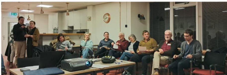
Foto-impressie van het Buurtplatform De Buitenpepers op dinsdagavond 26 maart, met dank aan Ken Yau. Het Buurtplatform De Buitenpepers komt twee keer per jaar bijeen en bestaat uit de contactpersonen van alle activiteitengroepen.