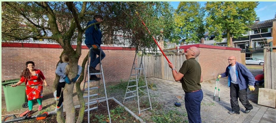
Bewoners van het westelijk erf van de Vierde Buitenpepers en de Buitenpepersdreef snoeien samen de bomen in hun brandgang.

Om toch het onderhoud goed te regelen is in 2006 de Vereniging Mandelig Eigendom Buitenpepers (VMEB) opgericht. Het snoeien en schoonmaken is uiteindelijk uitbesteed. Eerst aan het