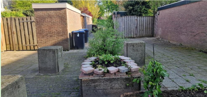
Bewoners van het oostelijk erf van de Vierde Buitenpepers en de Buitenpepersdreef hebben van enkele betonnen blokken plantenbakken gemaakt, waar eetbare groenten, fruit en bloemen ingezet worden.

De brandgang is nu een oase van groen geworden. Er zijn veel tegels gewipt, geveltuintjes aangelegd achter de schuurtjes met onder meer stok-