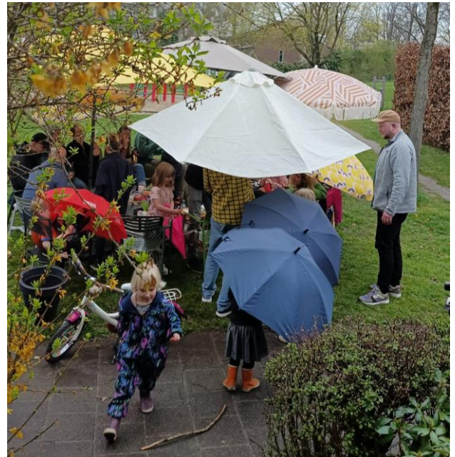
Bewoners van de Vierde Buitenpepers en de Buitenpepersdreef kwamen op de Paaszaterdag bijeen om hun brandgang op te knappen.