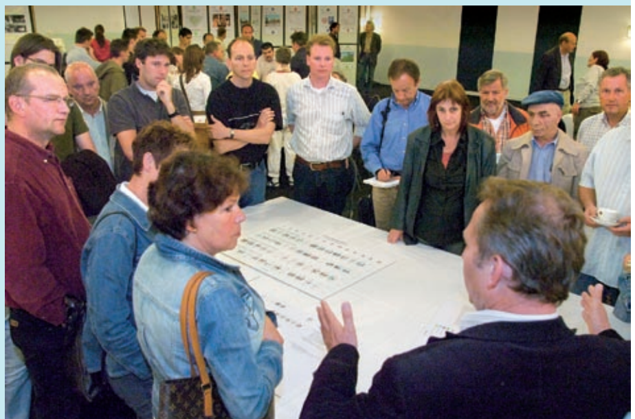
Op 2 mei en op andere bijeenkomsten droegen bewoners de bouwstenen aan voor de uitgangspunten van het wijkplan Boschveld Beweegt.

Allerlei uitgangspunten staan nu op papier. De aanpak van armoede bijvoorbeeld. En een goed voorzieningenpakket voor ouderen waardoor bewoners prettig oud kunnen worden in de wijk. Ook een Brede Bossche School met een goede buurtfunctie hoort daarbij. Net als