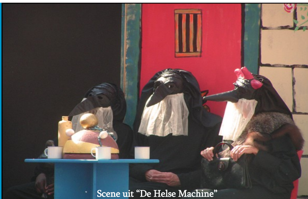
Scene uit "De Helse Machine"