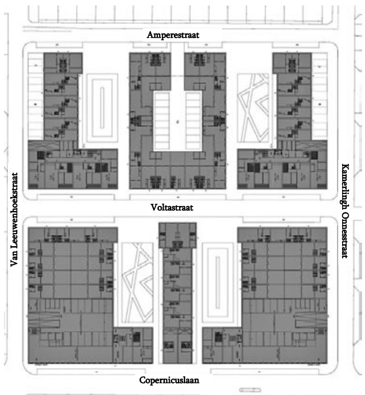
Bovenaanzicht plan Fase 1

Op 11 september om 19.30 uur zal in het Buurthuis een toelichting worden gegeven door de architect en kunt u uw reactie geven en vragen stellen. Daar zal ook de maquette aanwezig zijn. Schriftelijk kunt u natuurlijk ook reageren.