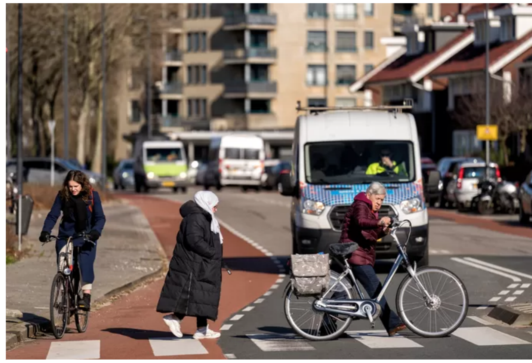
Drukte op de Oude Vijmenseweg in Den Bosch-West vanwege het vele (vracht)verkeer.

Godelieve Broeklander blijft het proces tot concrete maatregelen op de voet volgen. „Want er zijn nog heel wat noten te kraken voordat het zover is. Maar dit is echt een grote stap.”