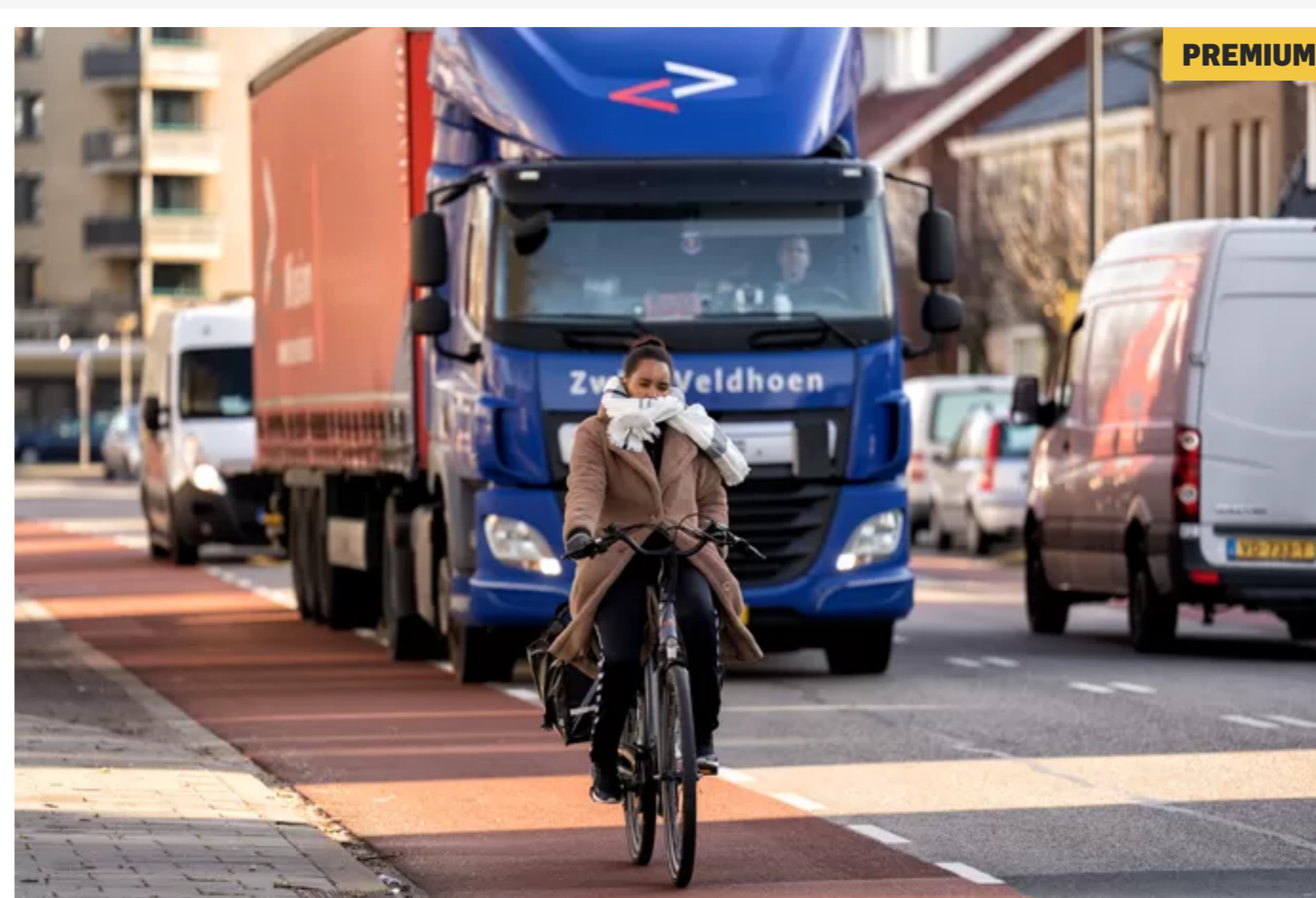
Vrachtwagen richting beentjenvaarten De Rietveldeer zorgt voor onveilige situaties in Den Bosch-West.