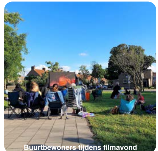
Buurtbewoners tijdens filmavond

Wil je op de hoogte zijn van diverse activiteiten voor jong en oud in onze buurt? Houdt dan onze Facebookpagina en/of Instagram in de gaten via: Buurteam Boschveld Deuteren Paleiskwartier @buurteambdp •