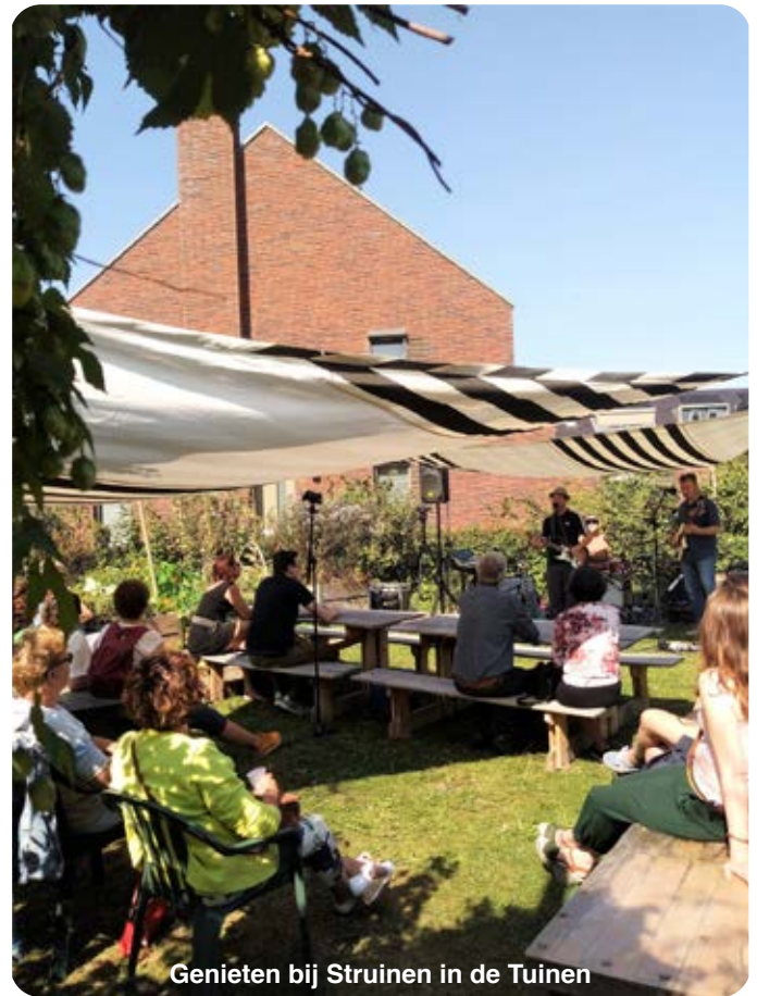
Genieten bij Struinen in de Tuinen

Mocht je nog meer willen weten over de Boschveldtuin, neem contact op via: info@boschveldtuin.nl , kijk op