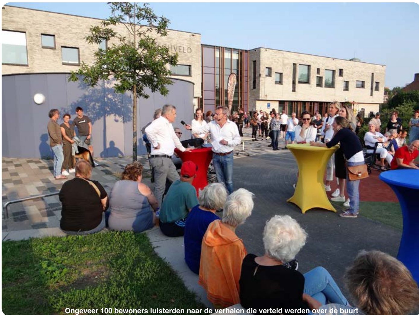
Ongeveer 100 bewoners luisterden naar de verhalen die verteld werden over de buurt

Op 19 juli vond de eerste editie van Boschveld Live plaats. Een gezellige avond mét en óver de wijk. De wijkraad (OBB) organiseert met enige regelmaat openbare vergaderingen waarvoor de bewoners uitgenodigd worden, maar de opkomst uit de buurt is daarbij doorgaans nogal mager. Vandaar een nieuwe opzet: een feestelijke avond op de speelplaats van de Brede Bossche School. Zo'n honderd bezoekers genoten ervan.