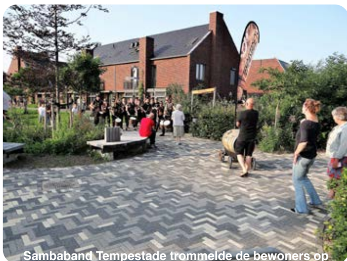
Sambaband Tempestade trommelde de bewoners op

Gezien het succes van de avond wil de wijkraad dat het hier niet bij blijft. Ze streeft naar een winterversie in januari en een nieuwe buitenversie vlak voor de zomervakantie. Het voelt als een mooie manier om de onderlinge betrokkenheid in de wijk te versterken. Dat mag een traditie worden. ●