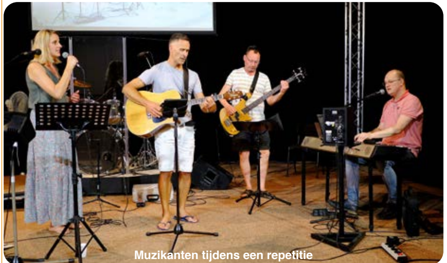
Muzikanten tijdens een repetitie