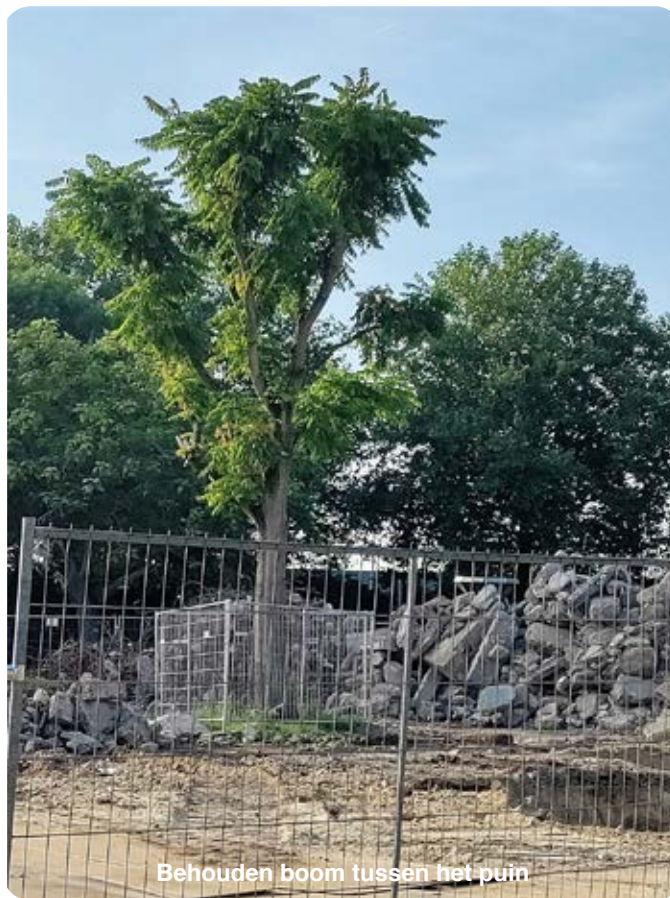
Behouden boom tussen het puin

Ook bij de plannen voor Vlek 21 willen we graag meedenken over de inrichting van de openbare ruimten. Dit najaar moet duidelijk worden hoe de gemeente met de inspraakreactie van de wijkraad wil omgaan. Deze ging onder andere over een parkeerplaats bij de Voltastraat die eigenlijk een groene plek zou worden. Bij de sloop van de flat aan de Copernicuslaan hebben we de gemeente erop gewezen dat de aannemer zich niet aan de afspraken hield, over de bescherming van de bomen. Nu staat er wel een hek om de boom.