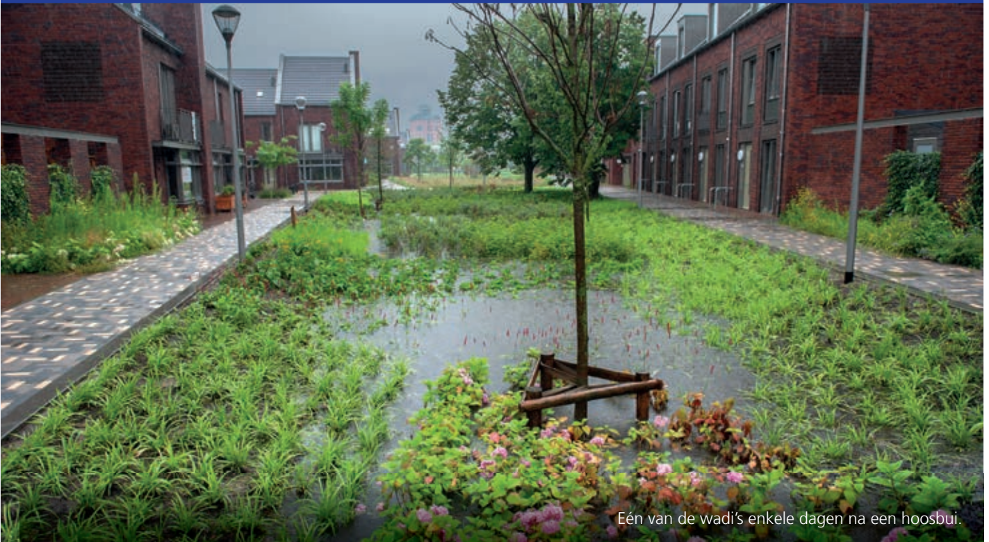
Eén van de wadi's enkele dagen na een hoosbui.