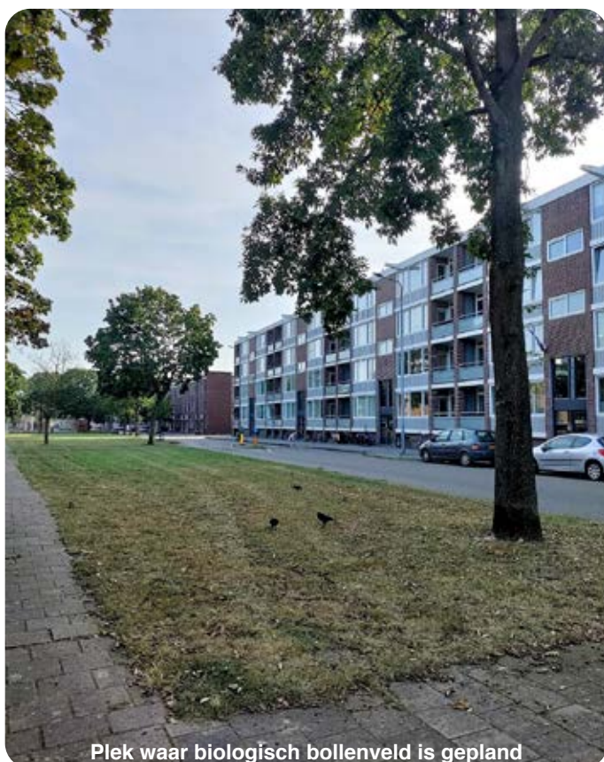
Plek waar biologisch bollenveld is gepland

Heb je zin om ook bollen te planten? Laat dan even van je horen via 06 - 1162 5903 of via de mail info@obboschveld.nl . Exacte tijd en misschien een extra plant-datum gaan we nog bedenken en laten we via websites, posters of flyers weten.