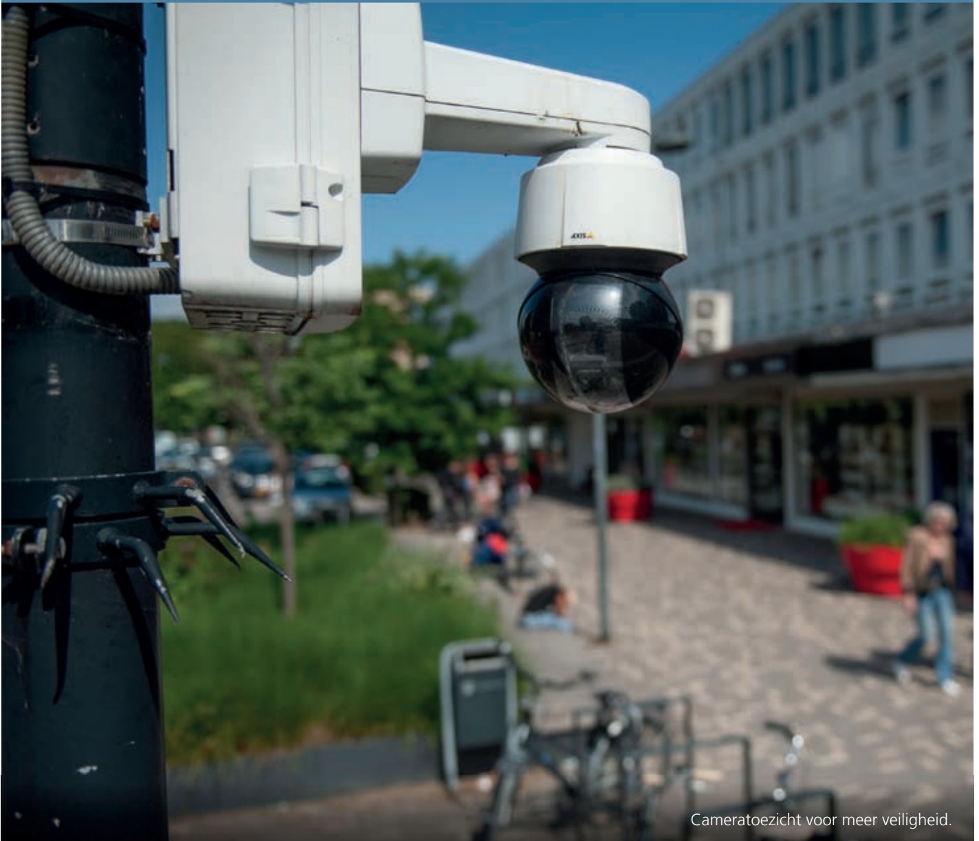
Cameratoezicht voor meer veiligheid.

“omdat er in Boschveld relatief veel verharding is, zoals gebouwen, wegen en bestrating”. Die vaststelling heeft betrekking op de periode waarin het onderzoek werd gehouden. Inmiddels is Boschveld juist veel groener geworden. Zo is het park Hart van Boschveld grotendeels klaar. Ook positief: in de Boschveldtuin werden bewoners zelf aan vergroening. Daar blijft het niet bij. In de toekomst komt er nog meer groen, zoals bijvoorbeeld aan de westkant van de Copernicuslaan,