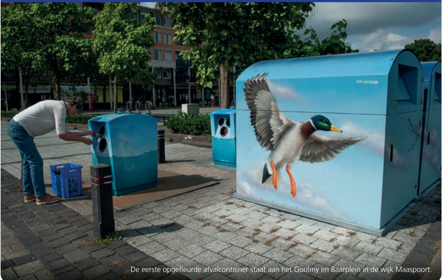
De eerste opgefleurde afvalcontainer staat aan het Goulmy en Baarplein in de wijk Maaspoort.