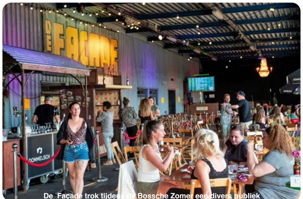
De Façade trok tijdens de Bossche Zomer een divers publiek