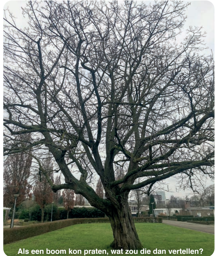
Als een boom kon praten, wat zou die dan vertellen?

Nu zijn we twee jaar verder en blijkt dat de wijze waarop we om zijn gegaan met deze tegenslag op sociaal gebied diepe wonden heeft achtergelaten. Ouderen zijn (nog meer) vereenzaamd, jongeren voelen zich depressief en sociaal geïsoleerd, groepen ondernemers zijn financieel aan de grond geraakt. Ook is er een enorme tweedeling in onze samenleving ontstaan (of misschien was die er al, maar dan niet zichtbaar). Enerzijds is dat begrijpelijk, maar anderzijds vraag ik me af of we nog wel goed met tegenslag kunnen omgaan. Op internet circuleert het verhaal wat je allemaal meegemaakt hebt als je in 1900 geboren bent. De eerste wereldoorlog van 1914-1918, direct gevolgd door de pandemie van de Spaanse griep, een economische crisis in de jaren 20, een tweede wereldoorlog van 1940-1945, de moeizame opbouw na die oorlog, van schaarste en woningtekort, de tijd van de hippies in de jaren 60 en de modernisering die vanaf de jaren 70 werd ingezet, maar ja toen was je al aan het eind van je leven.