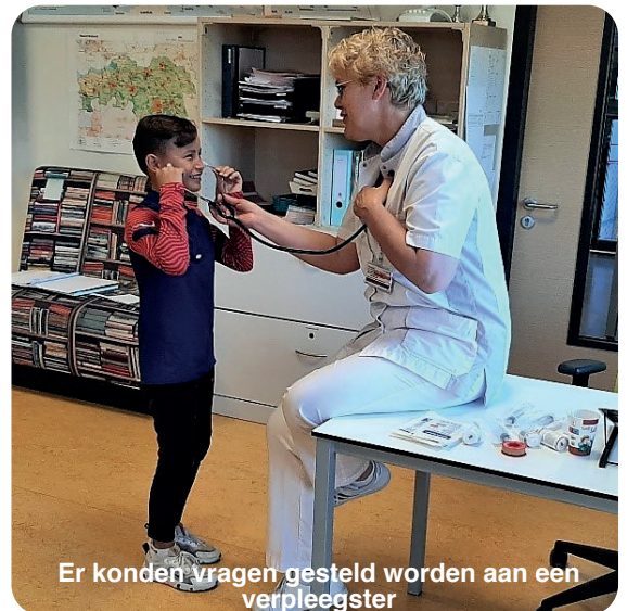
Er konden vragen gesteld worden aan een verpleegster