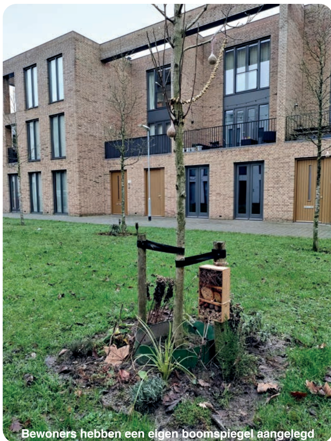
Bewoners hebben een eigen boomspiegel aangelegd

Als je het gezellig en leuk vindt om in één of meer boomspiegels (de ruimte rondom de bomen) zelf plantjes te zetten en deze minituintjes bij te houden, dan kan dat gewoon. Bewoners van één van de pleinen aan de Voltastraat zijn afgelopen herfst al van start gegaan (zie foto) en hebben vier boomspiegels gemaakt en 'gevuld'. Het grappige is dat veel planten die hier nu staan, stekjes zijn van de bestaande perken in onze buurt. In de herfst kun je namelijk veel planten vermeerderen; een groene oplossing om kosteloos aan plantgoed te komen. De gemeenteambtenaar die hierover gaat heet Arno Pullens (telefoon 06 - 2531 9085) en je kunt hem een appje sturen met je naam en het adres van welke boomspiegels of welk perk jij 'adopteert'. Arno zorgt er dan voor dat het op de lijst komt van de Weener XL onderhoudsploeg zodat zij het niet meer (om)schoffelen.