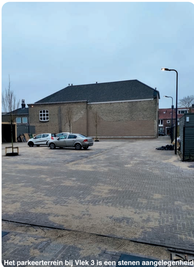
Het parkeerterrein bij Vlek 3 is een stenen aangelegenheid

De werkgroep ziet mogelijkheden om dit plein te veranderen in een veel aangenamer stuk. Zo is de aanplant van bomen, het vergroenen van gevels en meer perken met beplanting de enige mogelijkheid om hittestress tegen te gaan. Zoals het er nu bij ligt, is dit plein een bakoven als de temperatuur boven de 30 graden Celsius stijgt.