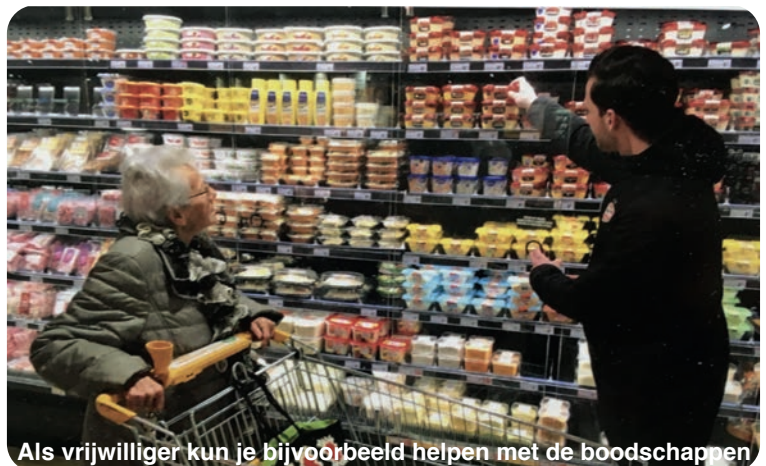
Als vrijwilliger kun je bijvoorbeeld helpen met de boodschappen

We zijn op zoek naar buurtbewoners die één of twee uren in de week tijd hebben om zich op die manier in te zetten voor iemand in de buurt met zo'n hulpvraag. Lijkt het jou ook leuk om vrijwilliger te worden bij de Vrijwillige Thuishulp van Farent? Of wil je wat meer informatie over de