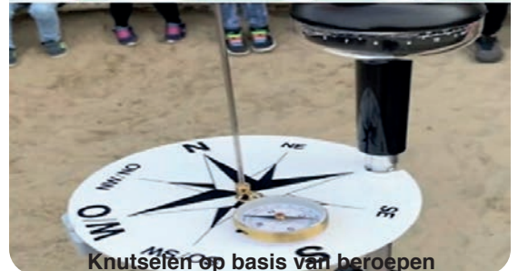
Knutselen op basis van beroepen