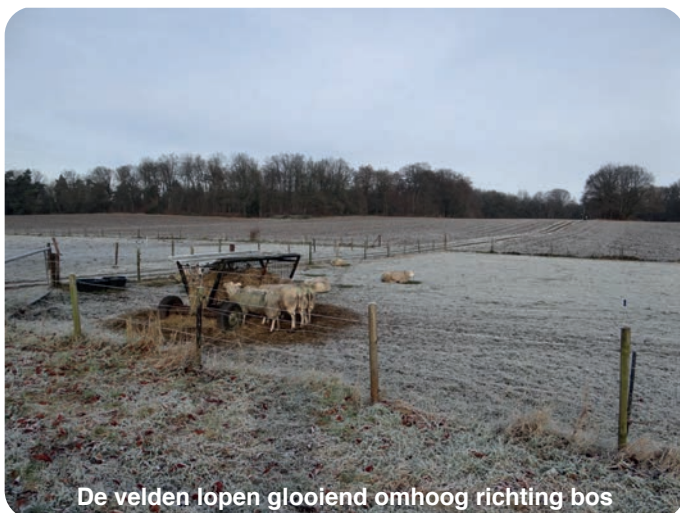
De velden lopen gloeiend omhoog richting bos

Achter de begraafplaats (bereikbaar vanaf het monument) loopt een pad langs een paar velden. Die velden zijn typerend voor de landgoederen. Je loopt langs een paar huisjes een breed pad op langs de landerijen waar schapen en paarden lopen. De velden lopen al licht gloeiend omhoog.