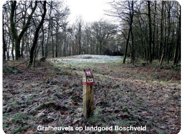
Grafheuvels op landgoed Boschveld

Na de velden kun je linksaf het bos in. Er lopen diverse paden. Je kan de lichtblauwe paaltjes volgen of het klompenpad. Boschveld is niet zo heel groot, maar bevat wel prachtige bomen en het (met rijp bedekte) groen is ook aanwezig. Je kan er heerlijk rondstruinen. Op het landgoed staan ook een paar huisjes waar ook mensen wonen. Er zijn ook nog twee grafheuvels waarschijnlijk 4000 tot 10.000 jaar oud. Aan vogels ook geen gebrek, zelfs niet op deze frisse winterdag.