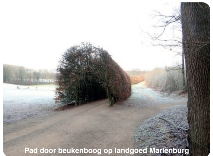
Pad door beukenboog op landgoed Mariënborg

Het landgoed wordt aan de ene kant begrensd door de begraafplaats en aan de andere kant door een weg. Als je de weg oversteeft kom je op landgoed Mariëndaal. Vroeger was dit, net als Boschveld, onderdeel van klooster Mariënborg. Dit klooster bestond van 1392 tot 1580. Het Mariëndaal is veel heuvelachtiger en ook groter dan Boschveld. Op één van de heuvels staat een kapelletje met een Jezusbeeld. Aan de andere kant ligt een pad dat omhoog loopt door een aangelegde beukenboog.