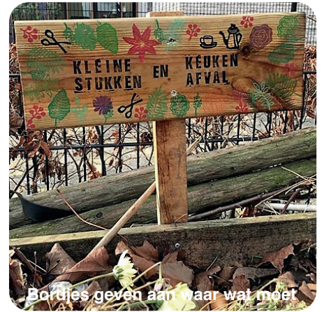
Bordjes geven aan waar wat moet

je even de deur uit wilt. Je kunt er overigens ook je eigen keukenafval en koffiedrab in kwijt. Liever geen citrusvruchten en broodresten: de eerste zijn te zuur en de tweede trekken vooral ongedierte aan. Zo maken we samen een mooie kringloop in de tuin.