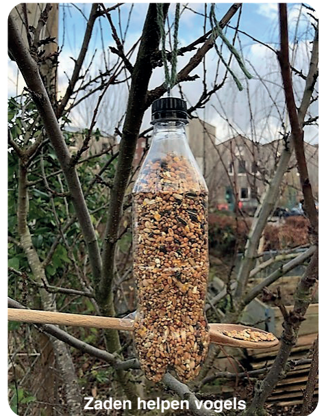
Zaden helpen vogels

Wil je vanuit huis wat meer vogels in je tuin of op je balkon zien? Zorg dan dat er wat lekkers is en dat ze een veilige plek hebben om te eten. Je maakt eenvoudig vogel-snacks met wat gesmolten frituurvet en vogelzaad. Zorg voor voldoende vet anders plakt het niet goed aan elkaar en gebruik bijvoorbeeld cupcakevormpjes om het in te scheppen. Stop er een satéprikker in zodat je straks een gaatje hebt voor een touwtje en laat het goed stollen. Bewaar in de koelkast, dan blijft het goed hard. Ook een zelfgemaakte voeddersilo van een petflesje trekt vogels aan. In de Boschveldtuin kun je een voorbeeld zien hangen. Heb je meer inspiratie nodig? Kijk dan eens op de website van de Vogelbescherming.