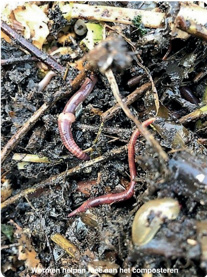
Wormen helpen mee aan het composteren

Het is niet overal stil in de tuin. Het is een drukte van jewelste in de compostbakken. Hier hoeft niemand zich aan 1,5 meter afstand te houden. Het is alle dagen feest voor de dieren die erin leven. Onze composthoek bestaat uit drie bakken. We hebben een rustbak: die bouwen we twee keer per jaar uit verschillende laagjes op (onder andere takjes, groentenaafval, bladresten, koffiedrab, mest van konijnen, cavia's of kippen en de oneindige stroom snoeiafval van de tuin) en laten we dan verder een half jaar met rust. De inhoud van deze bak wordt opgesnoept door allerlei beestjes en hun 'poep' noemen we compost. Dit is supervoedzaam voor de bodem én we verwerken zo ons eigen 'afval'. In de middelste compostbak verzamelen we door het jaar heen klein geknipte stukken en keukenafval. Dat gebruiken we dan weer als we een nieuwe rustbak maken.