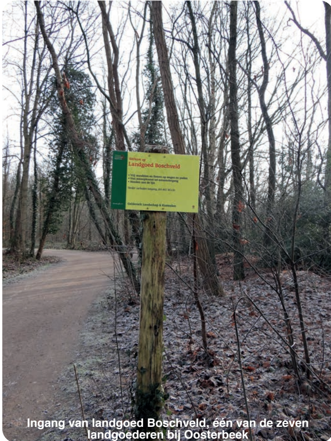
Ingang van landgoed Boschveld, één van de zeven landgoederen bij Oosterbeek

Het was op de eerste winterdag in deze winter dat ik naar landgoed Boschveld trok. De naam was ik al diverse malen tegengekomen en ik wilde het nu wel eens met eigen ogen zien. Geen wandeling in onze eigen buurt dus, maar 70 kilometer verderop.