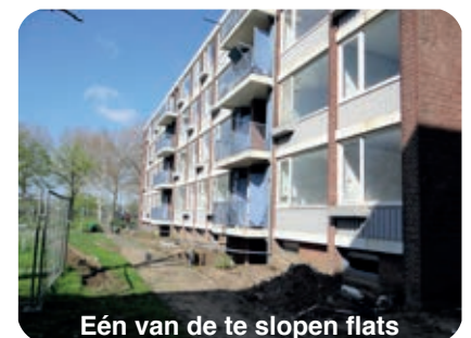
Eén van de te slopen flats

In januari is firma van Liempd gestart met de sloop van twee van de zeven flats van BrabantWonen langs de Oude Vlijmenseweg. Eerst is asbest verwijderd, daarna zou de rest volgen. Zoals u in het artikel in Wijkgericht kan lezen heeft de sloop stilgelegen, omdat de toezichthouder twijfelde of het onderzoek naar het voorkomen van vleermuizen goed was gedaan. Sinds 18 mei is de sloop weer verder gegaan. Dit leidt tot enige vertraging van de uiteindelijke oplevering van de nieuwbouw. Momenteel zoekt BrabantWonen een geschikte aannemer die de bouw gaat uitvoeren.