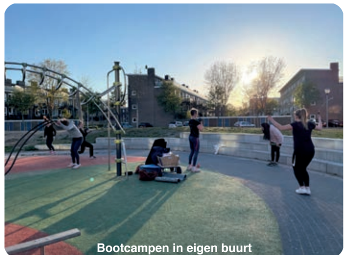
Bootcampen in eigen buurt

En niet onbelangrijk, het is ook heel gezellig om zo samen te trainen en je leert andere bewoners uit de wijk kennen. De lessen zijn op woensdagavond en zaterdagochtend. Bij interesse zie www.dondersfit.nl/bootcamp en natuurlijk kun je ook contact opnemen met Madelon via email bootcamp@dondersfit.nl of telefonisch via 06 - 2956 2624. ●