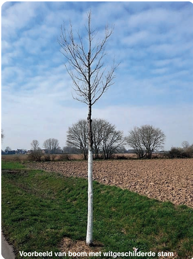
Voorbeeld van boom met witgeschilderde stam

Schrik dus niet als u een wit geverfde, sterk gesnoeide boom in een hoop compost ziet staan, het draagt allemaal bij aan een groene en leefbare buurt. •