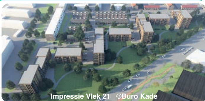
Impressie Vlek 21