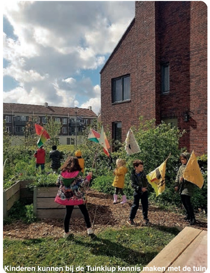
Kinderen kunnen bij de Tuinklup kennis maken met de tuin