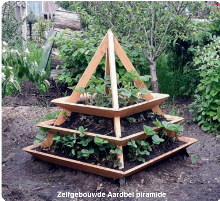
Zelfgebouwde Aardbei piramide