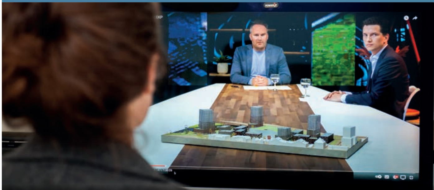
Belangstellenden werden online geïnformeerd over de nieuwe inrichting van het EKP-terrein.

In het verlengde daarvan komt er een proef voor bewoners van Boschveld om de auto een tijdje te parkeren op het EKP-terrein en gebruik te maken van elektrisch deelvervoer dat beschikbaar komt. “Het is de bedoeling dat mensen ervaren dat er in de buurt zo ruimte ontstaat en dat je daarmee van alles kunt doen. Zo kan er meer speelgelegenheid komen”, vertelde Jansen. De proef wordt Mobility Challenge genoemd, mobiliteits-uitdaging. Het blijft niet bij deze online bijeenkomst. Er komen nog werksessies over specifieke thema’s, zoals groen, spelen en inrichting Parallelweg. Voor meer informatie: www.ekp-denbosch.nl . Op deze site kan de talkshow worden teruggekeken.