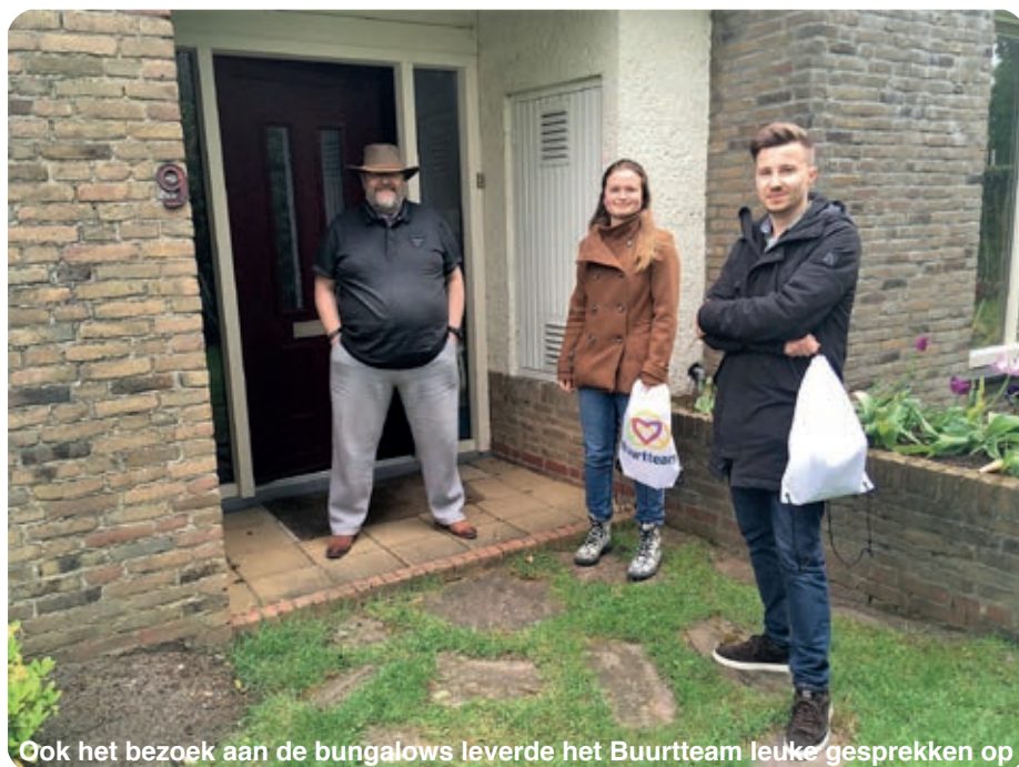
Ook het bezoek aan de bungalows leverde het Buurteam leuke gesprekken op

Na de zomervakantie? Dat zou fantastisch zijn! •