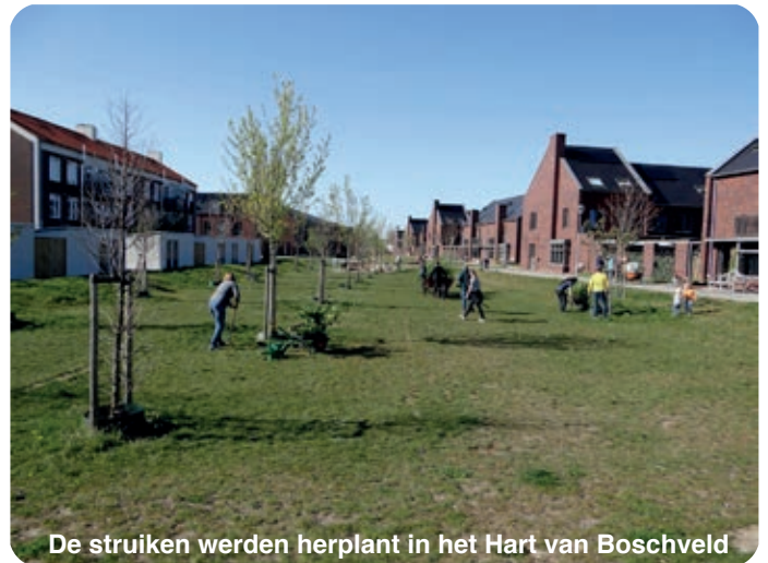
De struiken werden herplant in het Hart van Boschveld

Zo'n tien struikrovers liepen van de Boschveldtuin naar de sloopflat aan de Copernicuslaan. Aan de kopse kant stonden flink wat Viburnum (sneeuwbal) struiken. Onder de struikrovers waren ook wethouder Mike van der Geld en raadslid Geert Verbruggen. Er werd flink doorgewerkt en in ruim één uur waren de planten verwijderd. Met een bakfiets en een aantal kruiwagens werden de planten naar het Hart van Boschveld en de perken bij de BBS gebracht.