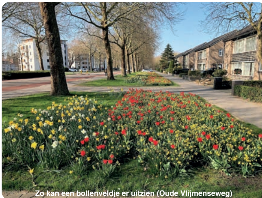
Zo kan een bollenveldje er uitzien (Oude Vlijmenseweg)

De werkgroep Groen en Spelen heeft, met instemming van de gemeente, 1 van de 15 gratis biologische bollenveldjes van Brabant aangevraagd bij Velt (Vereniging voor Ecologisch Leven en Tuinieren) en de Provincie Noord-Brabant. En dat is ge-