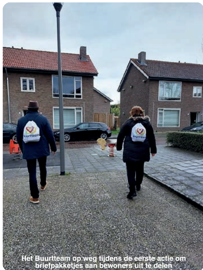
Het Buurteam op weg tijdens de eerste actie om briefpakketjes aan bewoners uit te delen

Vandaar dat we nieuwe briefpakketjes hebben samengesteld met informatie over het Buurteam, Koo Wijkplein, coronahulp initiatieven en iets leuks.