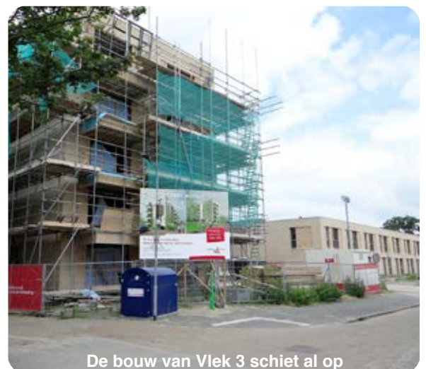
De bouw van Vlek 3 schiet al op

De appartementen van Brabantwonen zullen pas dit najaar worden opgeleverd. Begin juni werd wel het hoogste punt bereikt. Nu moeten de woningen nog worden afgewerkt. De woningen zijn al (grotendeels) toegevoerd. Het gaat veelal om bewoners van Vlek 21 die gebruikmaken van de doorverhuismogelijkheid ●