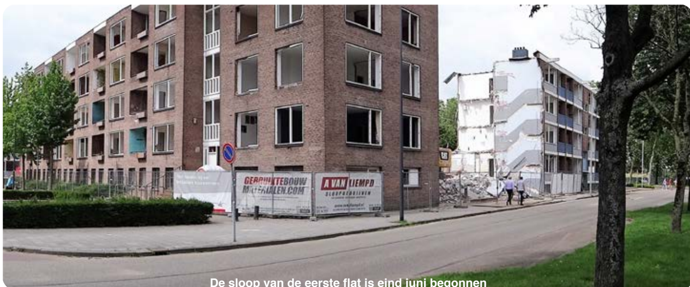
De sloop van de eerste flat is eind juni begonnen

Naar verwachting zal de bouw het laatste kwartaal van dit jaar starten. Meestal duurt dit een jaar. ●