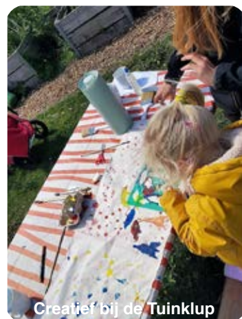
Creatief bij de Tuinklup

Mocht je nog meer willen weten over de Boschveldtuin, neem contact op via: info@boschveldtuin.nl , kijk op www.boschveldtuin.nl , volg ons op www.facebook.com/boschveldtuin of kom op vrijdagmiddag even aanwippen. Tussen 15.00 en 16.30 uur zijn er altijd mensen in de tuin, rond 16.00 uur kan je ook gezellig aanschuiven voor een kopje koffie/thee, met een koekje of taart als er weer iets te vieren is. ●