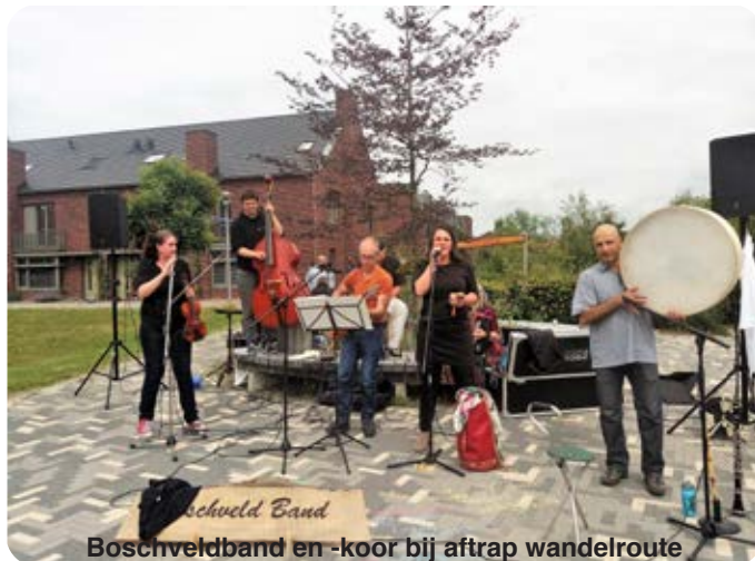
Boschveldband en -koor bij aftrap wandelroute

Op 2 juli was de aftrap in de tuin met daarbij een prachtig nieuw wijklied, gespeeld door de Boschveldband en gezongen door het Boschveldkoor.