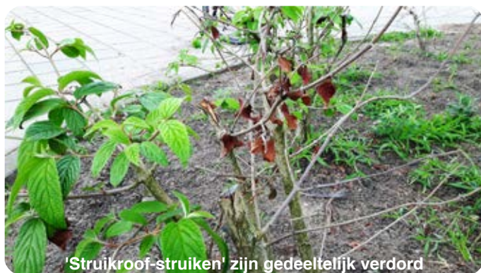
'Struikroef-struiken' zijn gedeeltelijk verdord

Nu de bouw van de woningen en appartementen aan de Edisonstraat/ Celsiusstraat /Copernicuslaan al flink opschiet wordt er ook gesproken over alle andere elementen die een plekje moeten krijgen: bomen en ander groen, plekken voor auto's en fietsen, prullenbakken. De wijkraad heeft de plannen laat aangeleverd gekregen met vermelding 'definitief'. We denken altijd dat we meedenkende partij zijn, maar dat valt soms toch een beetje tegen. In ieder geval werken we weer hard door om zaken die niet kloppen nog bijgestuurd te krijgen.