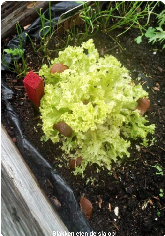
Slakken eten de sla op