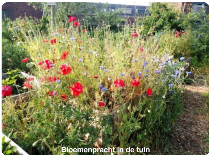
Bloemenpracht in de tuin

Het is nu volop zomer in de tuin. En wat voor zomer, door de regen in het voorjaar en daarna het lekkere warme zonnetje in juni is de tuin geëxplodeerd. Je ziet er alle tinten groen en de bloemenpracht straalt je tegemoet.