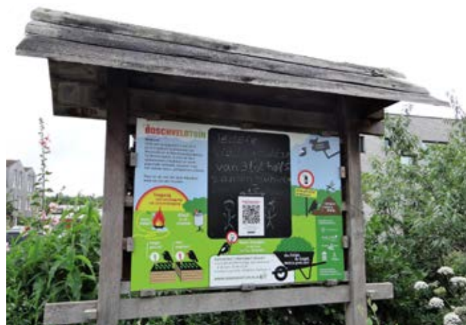
De QR codes zijn op diverse plaatsen in de buurt te vinden