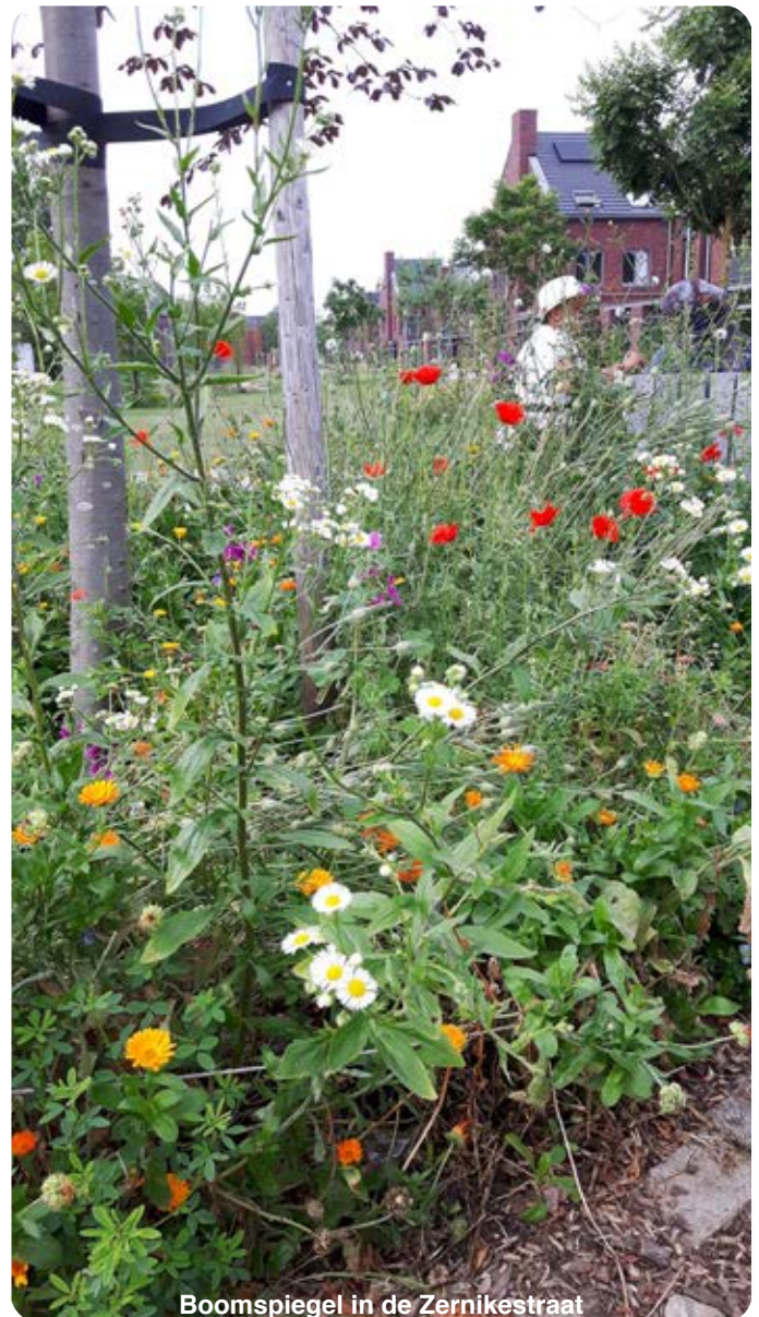
Boomspiegel in de Zernikestraat