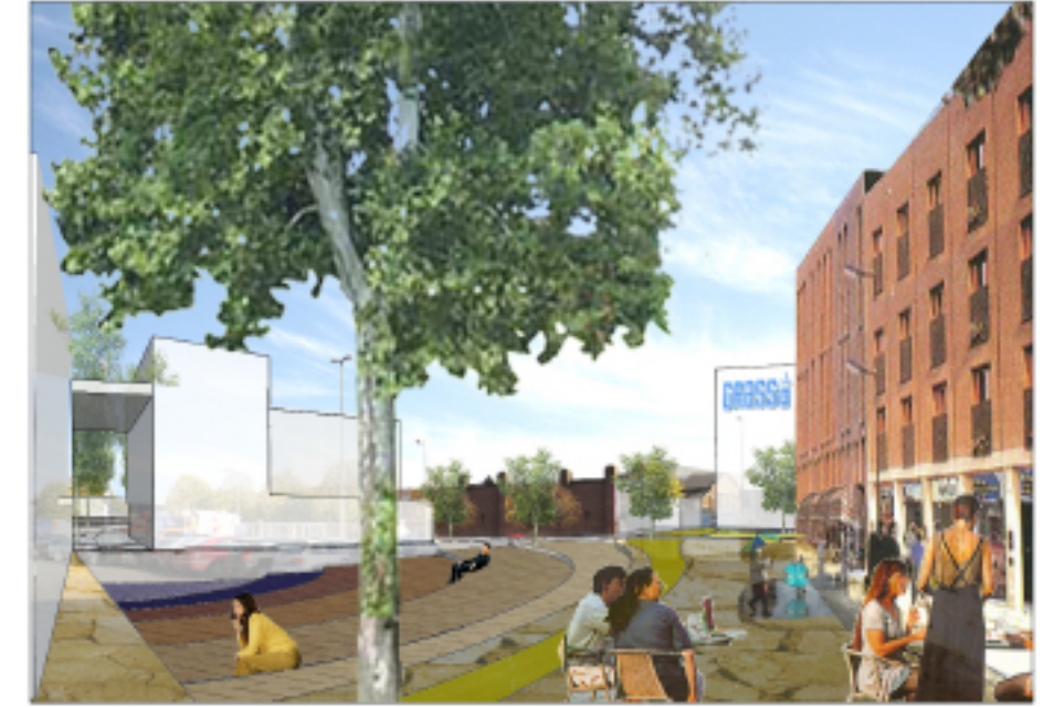
Grassoplein, met nieuwe kop Grasso