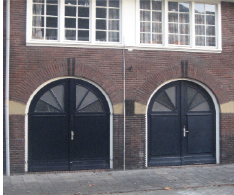
foto 'stallen' Veemarktkwartier