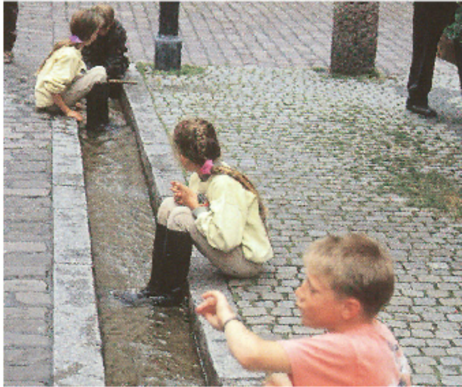
referentiebeeld openbare ruimte