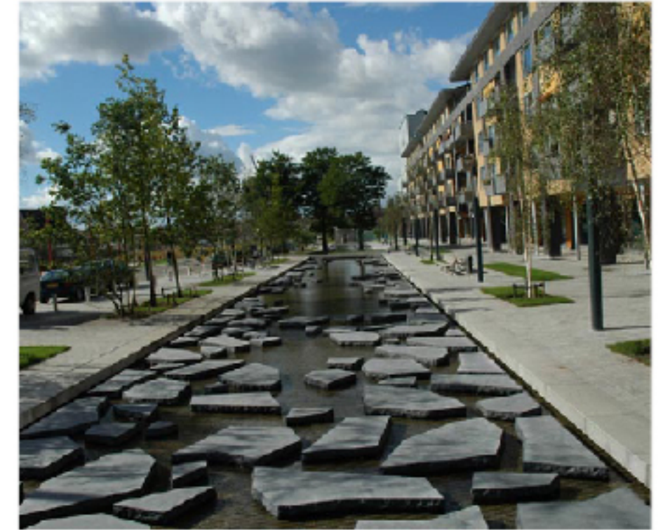
referentiebeeld openbare ruimte

In het Waterkwartier speelt de verbinding met het water een grotere rol dan de verbinding met het groen. Hier ligt de stad letterlijk aan het water. Er komt een wandelroute of kade langs de Dieze die de relatie tussen de wijk, de stad en het water versterkt. De Diezekade heeft de potentie om uit te groeien tot een dynamische ontmoetingsplek voor Boschvelders en andere Bosschenaren.