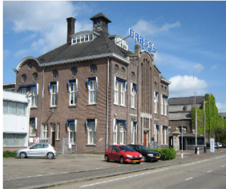
Grasso, nog steeds in bedrijf