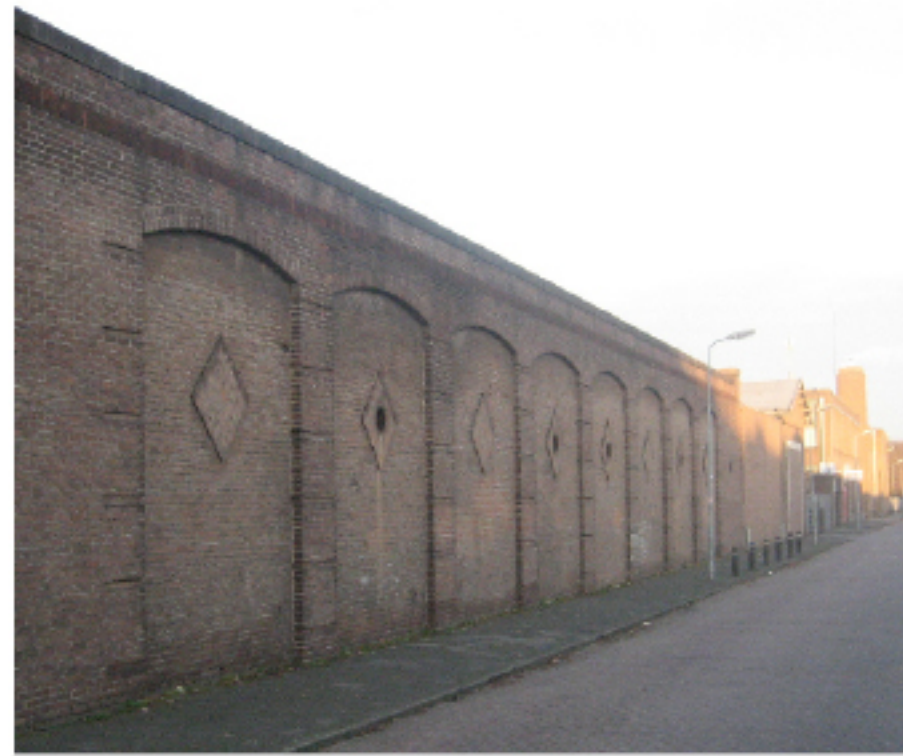
foto bestaande hallen Paardskerkhofweg