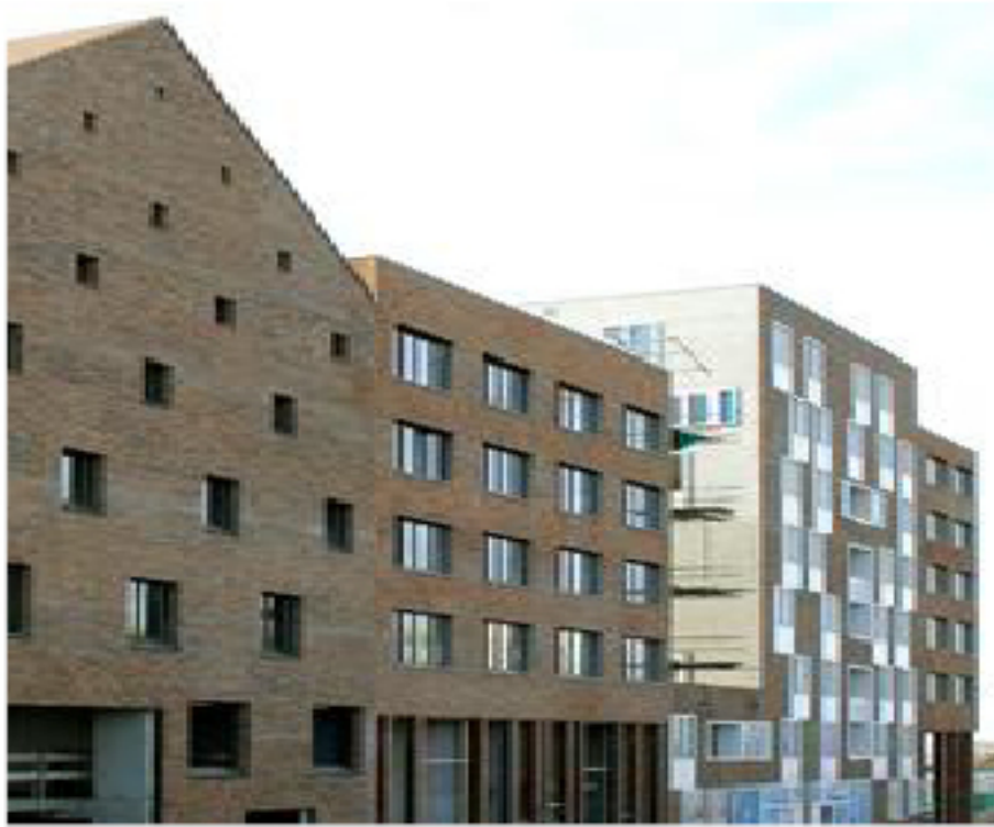
referentiebeeld samengestelde bouwblokken