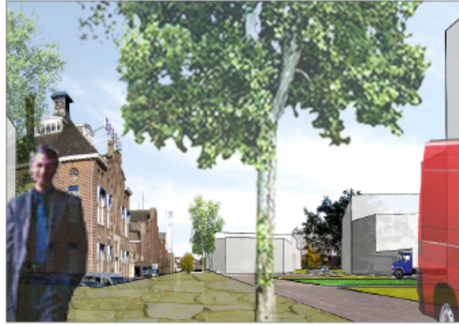
Parallelweg, kantoren EKP-terreinzorgen voor buffer