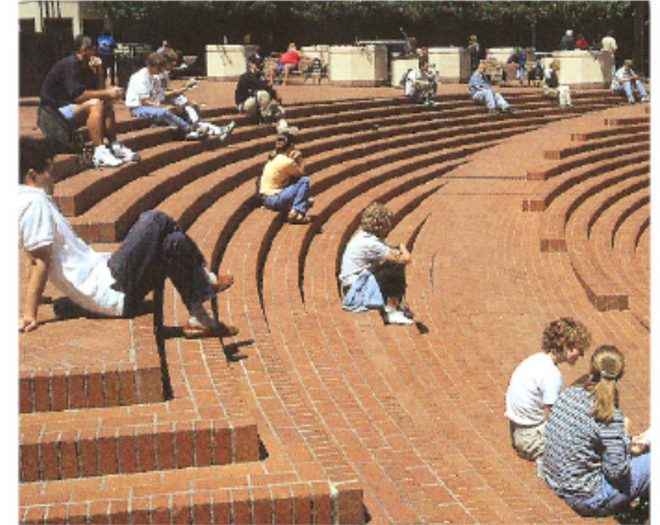
referentiebeeld amfitheater (Westplein)

moeten de aanwezigheid van Grasso versterken en de entree verbijzonderen. De bomenrijen van de kruisende lanen geven het plein een groen karakter.