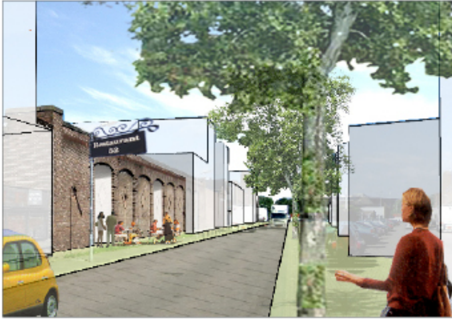
Paardskerkhofweg, historische panden inpassen