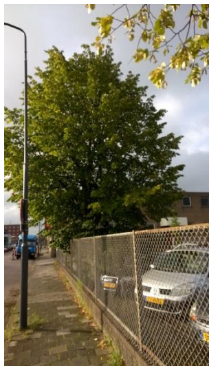
Boom 1 en 4