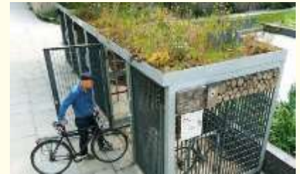
usief bouwen, eenvoud