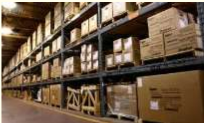
productie en functionaliteit is belangrijk