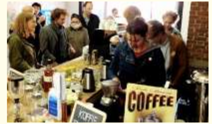
hospitality concept; gastvrij en service