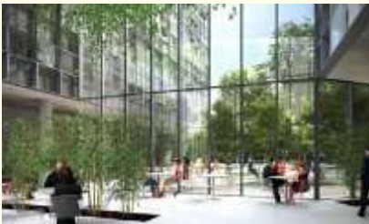
contact tussen binnen en buiten