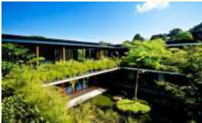
groene binnentuinen spreken aan,