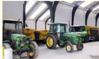
werken mag gezien worden