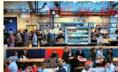
plaza als bedrijfsverzamelgebouw / take me away