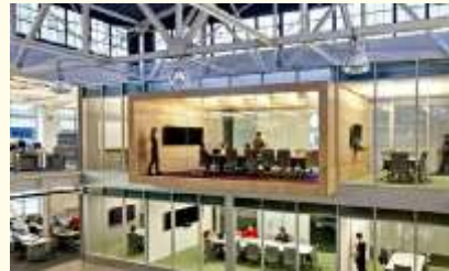
transparatie is belangrijk