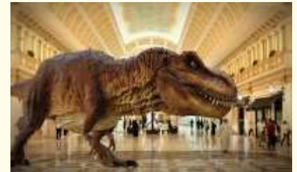
inspirerend, out of the box; in your face