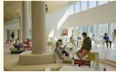
plaza; open, routing en contact