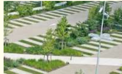
gescheiden verkeersstromen en goede verlichting