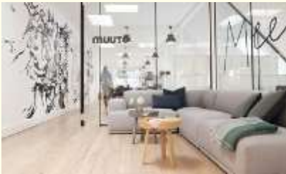
transparant en ingedeeld op basis van activiteiten