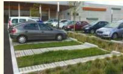
laag groen geeft overzicht en veiligheid