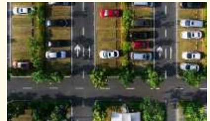
groen combineren met parkeren, liever nog groener