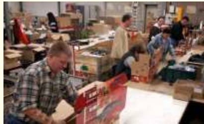
zien dat er gewerkt wordt!