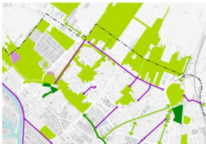
Kaart uit actualisering groenstructuurplan 2017-2030 (pagina 45) met in paars de opgaves voor groenverbindingen