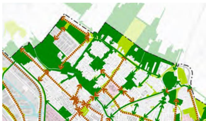
Kaart uit actualisering groenstructuurplan 2017-2030 (pagina 40) met de pijlen voor de wenselijke groenverbindingen