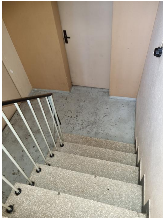
Stufen zum Keller