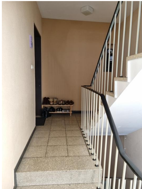
Treppenhaus 1. OG