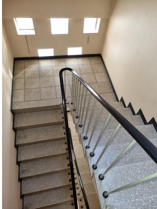
Blick von oben