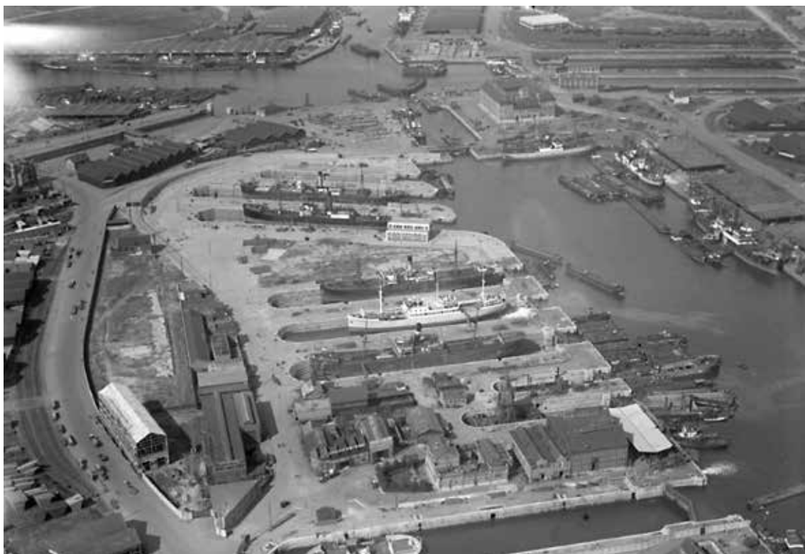
Droogdokken 1968