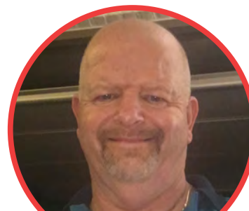
Hubert Paruys Limburg Samen