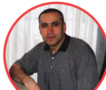
Deniz Ates S.L.A. vzw