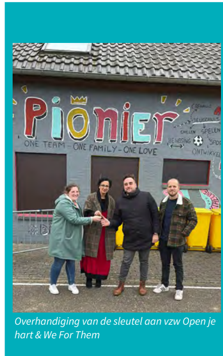
Overhandiging van de sleutel aan vzw Open je hart & We For Them

nemen. Zo kunnen zij kennismaken met de omgeving, met De Pionier en er een kopje koffie of thee nuttigen.