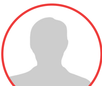
Arnaud Chokouadeu Tchuenqoue CUF Belgium

Graag meer weten over onze werking of wil je graag meehelpen? Stuur dan een mailtje naar info@vzwaif.be