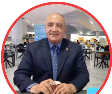
Rasooli Enayatullah Bighro vzw

Democratie en participatie zijn begrippen die wij hoog in het vaandel dragen binnen onze organisatie. Daarom vinden wij het zeer belangrijk dat onze leden zich kandidaat stellen voor ons Bestuursorgaan. Tijdens onze laatste Algemene Vergadering werd het nieuwe Bestuursorgaan van verkozen. We stellen ze graag even voor: