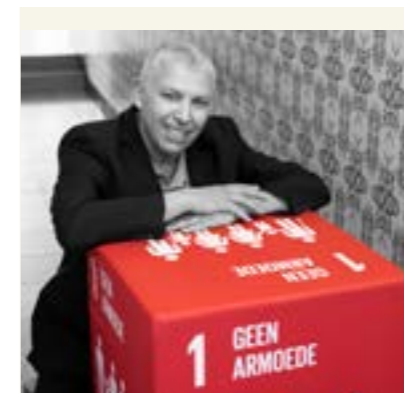
moskee Arrahman in Halle. Zij werden door de stad verkozen tot "Duurzame Held"

Het was heel fijn om een erkenning te krijgen van de Stad en de VVSG. Er zijn zoveel organisaties die zich solidair stellen met de samenleving en die deze erkenning ook zeker verdienen.