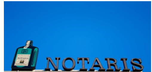
Deze foto van Onbekende auteur is

Na aanmelding ontvang je een week van tevoren per mail een link waarmee je aan dit online webinar deel kunt nemen.