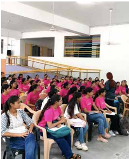
Shalinis met volle aandacht tijdens de workshop

In Jaipur werden onze Shalinis getraind in gezondheidsbewustzijn. Ze leerden over preventieve zorg, zelfonderzoek en vaccins om deze vormen van kanker te bestrijden. Dit programma versterkte hun kennis en moedigde hen aan om verantwoordelijkheid te nemen voor hun eigen gezondheid.