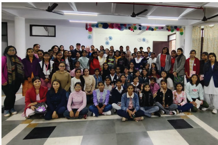
Met zijn allen op de groepsfoto in Greater Noida

Als we thuis zijn maar aan het fondsenwerven!