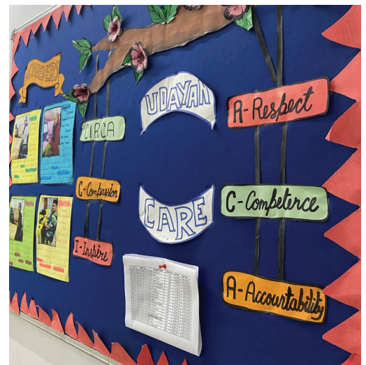
Udayan waarden aan de muur van het communitycentre

Vriendenkring Nederland kan dit werk doen dankzij uw steun. In India, maar ook in Nicaragua en Suriname. Heel erg bedankt voor uw blijvende ondersteuning.