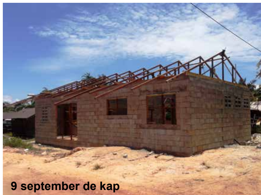
9 september de kap