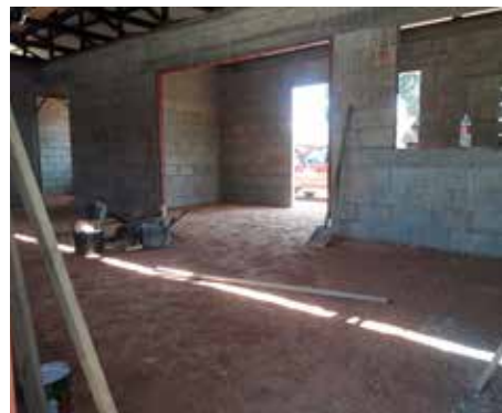
18 september de crèche van binnen