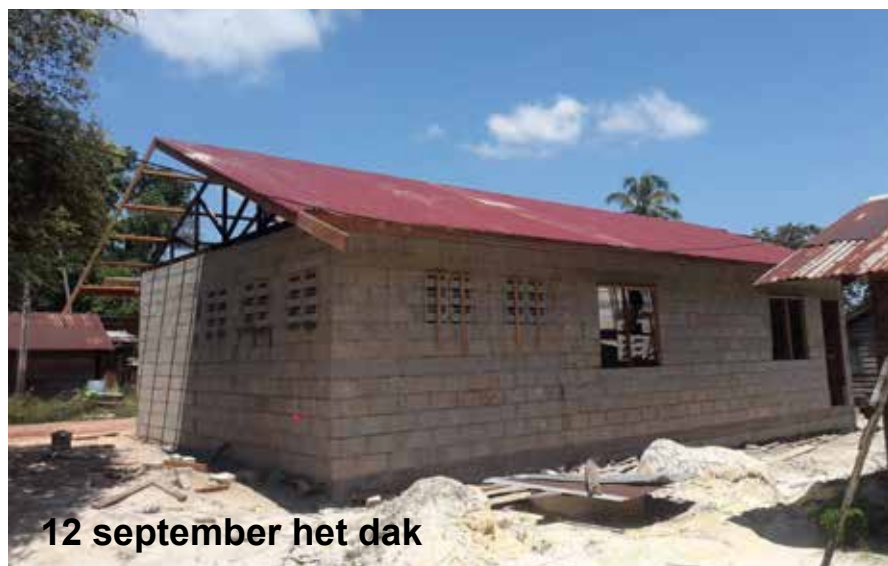
12 september het dak

Uw dankbare, Pater Toon te Dorsthorst omi.