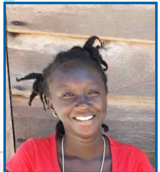
de aanstaande crècheleidster Renteniora