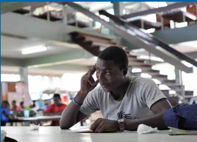
gebogen over de studieboeken, in de studiezaal van het Christoforusinternaat, denkend aan de kansen die hem gegund zijn