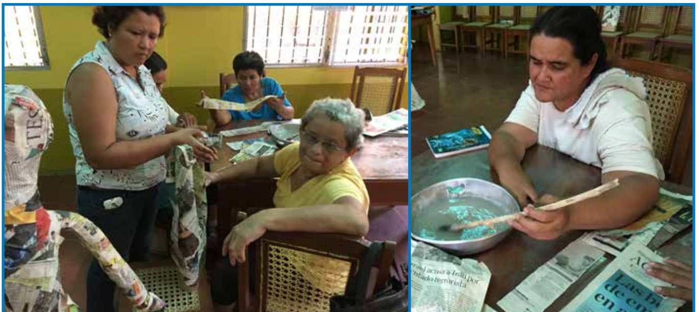
Hard aan het werk in Casa Esperanza