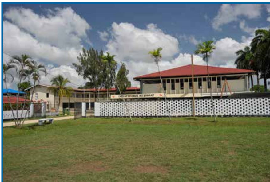
aankomst bij het Christoforus Internaat

Wilt u de nieuwsbrief digitaal ontvangen? Stuur dan een e-mail naar info@vriendenkringnederland.nl